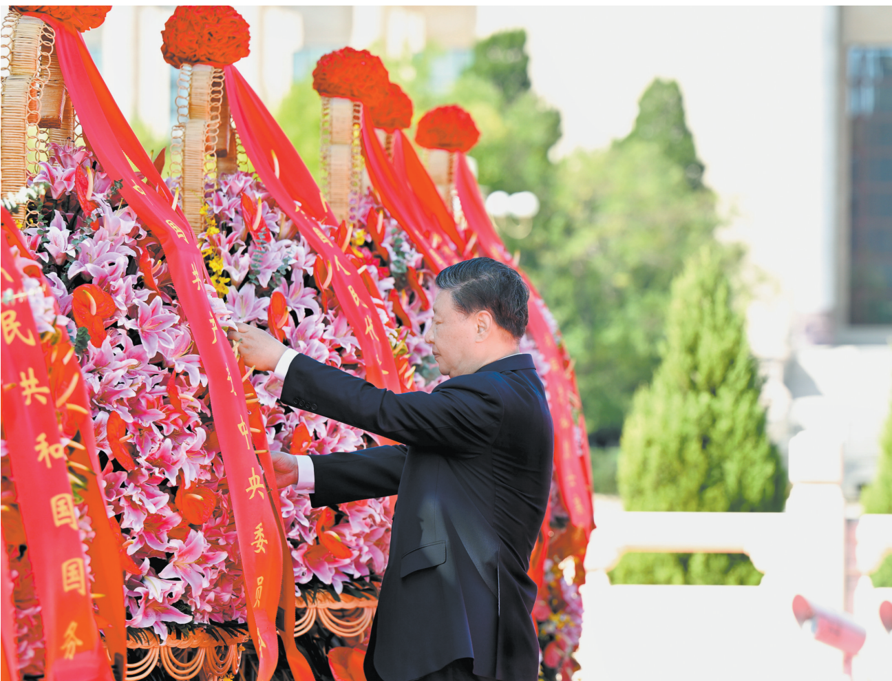
9月30日上午,党和国家领导人习近平、李强、赵乐际、王沪宁、蔡奇、丁薛祥、李希、韩正等来到北京天安门广场,出席烈士纪念日向人民英雄敬献花篮仪式。这是习近平整理花篮上的缎带。