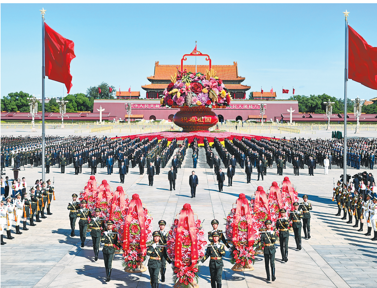
9月30日上午,党和国家领导人习近平、李强、赵乐际、王沪宁、蔡奇、丁薛祥、李希、韩正等来到北京天安门广场,出席烈士纪念日向人民英雄敬献花篮仪式。