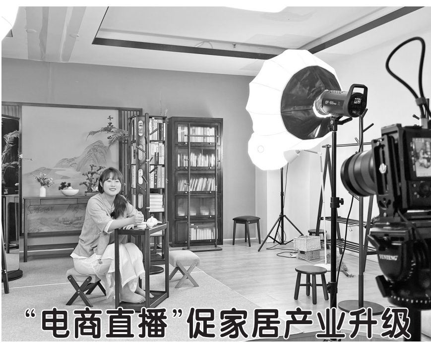
“电商直播”促家居产业升级

“欢迎新进来的朋友们,我们家的家具既环保,质量又好,价格还实惠……”近日,在曹县睿帆家居直播现场,工作人员正在推销产品。该企业主要产品有客厅家具、餐厅家具、卧室家具等1000多个品种,在多个平台开设了40余个网店,并通过直播带货的模式促进家具销售。据了解,近年来,曹县以电商为依托,通过“电商+实业”的模式,推进企业战略转型,有效带动了家居产业转型升级。