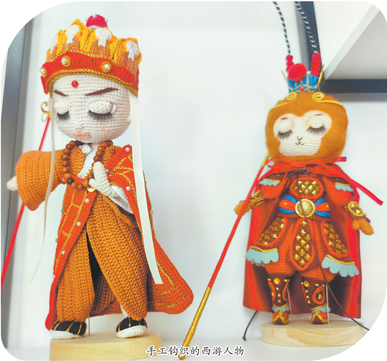
手工钩织的西游人物