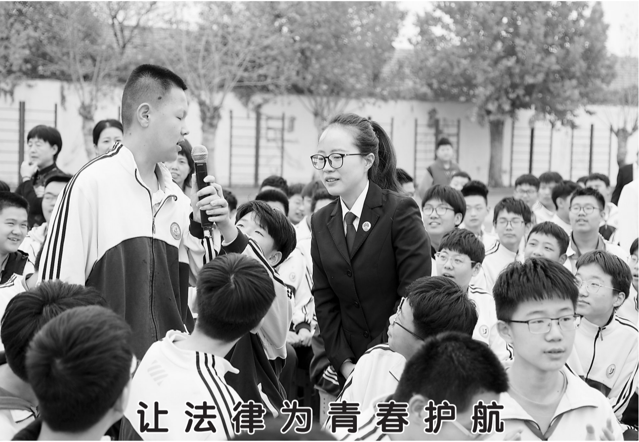
▲为增强中学生知法、懂法、尊法和用法的意识，提高自我保护能力，近日，鄄城县检察院走进该县第一初级中学，为学生们送上一堂法治教育课。课堂上，该院未检干警通过授课、提问、现场互动等形式，结合鲜活案例“以案释法”，以生动的方式解释跑分、刷单、校园贷等多种诈骗类型，让学生们了解身边的诈骗陷阱，用法治阳光为“青春之路”保驾护航。