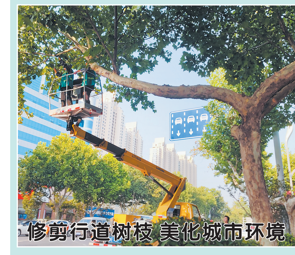
修剪行道树枝 美化城市环境

区纪委监委以家风带党风、严正风、促文明,把家风建设作为培育家国情怀、筑牢廉洁防线、推进文明创建的重要举措之一,让勤勉廉洁成为家庭生活的一种方式。2月18日,举行首届“勤勉廉洁最美家庭”表彰大会,评选出58户最美家庭,引导党员干部注重家庭、家教、家风。 为筑牢纪检监察文明阵地,区纪委监委利用机关院落、走廊、显示屏等载体,加强社会主义核心价值观、文明新风尚、崇德向善、清正廉洁等主题宣传,让纪检监察干部在耳濡目染中提升文明意识,在潜移默化中树牢行为准则,打造昂扬向上、健康文明的文化氛围。 定陶区纪委监委持续开展“我们的节日”活动,开展“包汤圆 话清廉——元宵节”