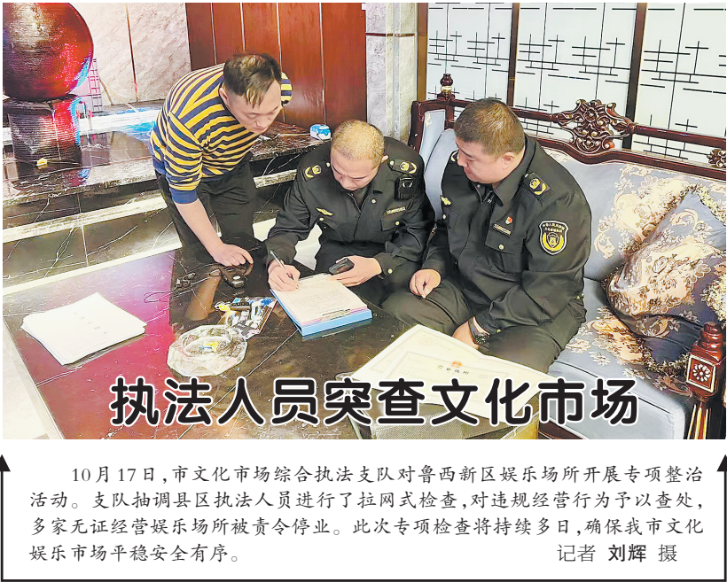
执法人员突击文化市场

10月17日,市文化市场综合执法支队对鲁西新区娱乐场所开展专项整治活动。支队抽调县区执法人员进行了拉网式检查,对违规经营行为予以查处,多家无证经营娱乐场所被责令停业。此次专项检查将持续多日,确保我市文化娱乐市场平稳安全有序。