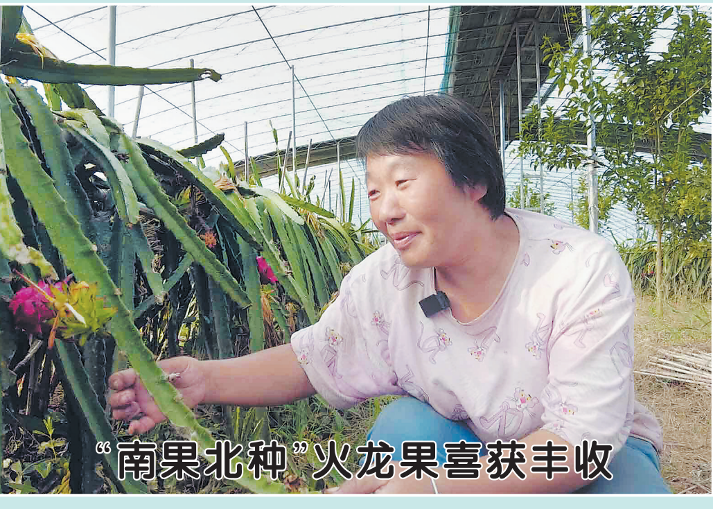
“南果北种”火龙果喜获丰收

本报讯(记者 彭传军 通讯员 王晓斐)近日,东明县刘楼镇新时代文明实践所开展形式多样的美德信用宣传宣讲活动。通过“美德信用+文艺”的形式,精心编排快板特色节目,演奏美德信用交响曲,打造家门口的“美德信用课堂”。