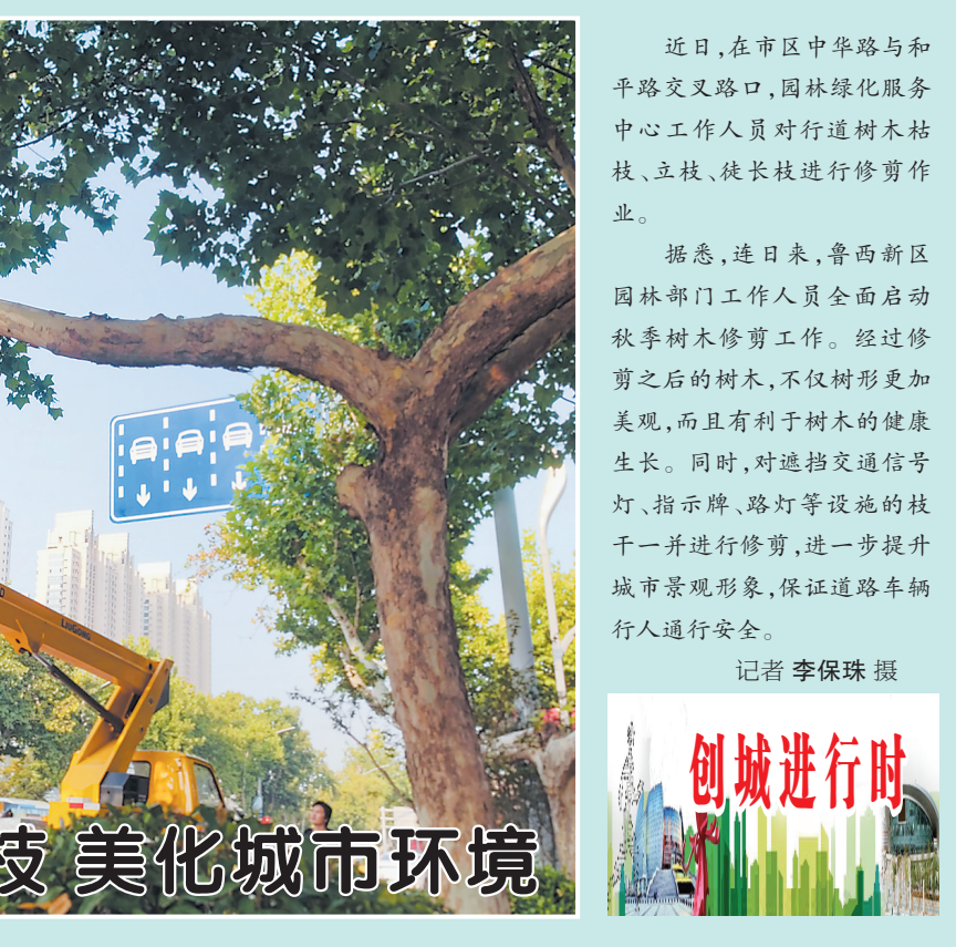
修剪行道树枝 美化城市环境

近日,在市区中华路与和平路交叉路口,园林绿化服务中心工作人员对行道树木枯枝、立枝、徒长枝进行修剪作业。 据悉,连日来,鲁西新区园林部门工作人员全面启动秋季树木修剪工作。经过修剪之后的树木,不仅树形更加美观,而且有利于树木的健康生长。同时,对遮挡交通信号灯、指示牌、路灯等设施的枝干一并进行修剪,进一步提升城市景观形象,保证道路车辆行人通行安全。