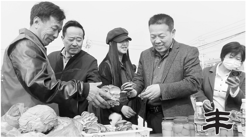
▲日前，单县蔡堂镇农民丰收节庆祝活动中，农民朋友正向客商介绍展出的优质农产品

彭忠民教授表示，山东省立医院胸外科团队将会与巨野县人民医院胸外科同事一起，加强学科建设，在新技术、新业务开展、复杂手术指导与培训等方面给予支持与帮助，将胸外科诊治能力再推向一个新的台阶。