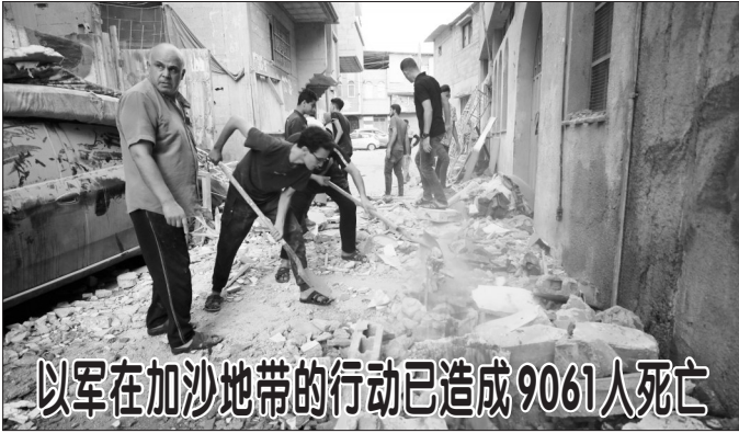
以军在加沙地带的行动已造成9061人死亡

和不干涉各国内政等原则。 1959年古巴革命后，美国政府对古巴采取敌视政策。1961年，美古断绝外交关系。次年，美国对古巴实施经济、金融封锁和贸易禁运。过去30年来，联合国大会一直呼吁美国结束自1962年以来对古巴实施的经济封锁。