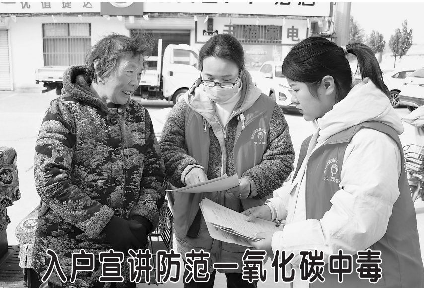
11月13日，定陶区滨河街道志愿者在崔庄社区德润广场开展冬季防范一氧化碳中毒宣传活动。活动中，志愿者向群众发放《预防一氧化碳中毒知识》明白纸，宣讲一氧化碳中毒常见原因、中毒表现和急救措施等常识。据悉，天气转冷以来，滨河街道加大了冬季取暖安全知识进村入户的宣传力度，强化风险排查和整改，及时消除安全隐患。

居住环境越来越干净了，村民的生活习惯也越来越好了。”后董村村干部韦丽君在环境卫生整治现场对笔者说。 “村民既是农村人居环境整治的受益者，也是参与者。让村民实实在在地感受到人居环境整治的好处，再充分发挥村民的主体作用，调动其积极性，人居环境整治才能获得持久的内生动力。”仿山镇党委副书记邓卫华说。 通过全民动员、全员参与，仿山镇全镇上下形成了比学赶超、大抓落实的浓厚氛围，共同维护整洁的村容村貌。