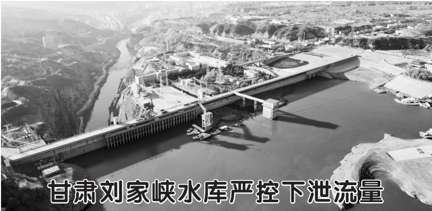
甘肃刘家峡水库严控下泄流量

在亚太经合组织第三十次领导人非正式会议上，习近平主席呼吁各方深入思考亚太发展的时代之问：“要把一个什么样的亚太带到本世纪中叶？如何打造亚太发展的下一个‘黄金三十年’？在这一进程中如