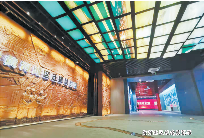
黄河滩区迁建展览馆

近日，走进鄆城县文化体验廊道——临濮镇苏酒庄村，黄河岸边的银杏林如约披上盛装，吸引众多游客前来拍照、游玩。徜徉在百亩银杏林，微风轻抚，枝叶摇曳，人们行走在暖暖的阳光下，如同漫步在童话世界里，陶醉其中。