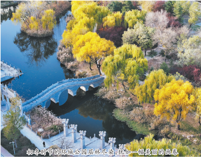
初冬时节的环城公园层林尽染,犹如一幅美丽的画卷

菏泽城是美丽的。春天,牡丹花开,鲜花烂漫;夏天,热烈奔放,郁郁葱葱;秋天,果实累累,多姿多彩;冬天,层林尽染,色彩斑斓。 在环堤公园、环城公园、赵王河公园以及城市道路两旁,柳树、枫树、法桐、银杏……变换出别样的色彩,呈现出一年当中最美的景色。 初冬晴朗的天气里,温暖柔和的阳光穿过树叶的缝隙,洒在落叶上,形成一片片斑驳的光影。美丽的自然景观与别致的城市建筑相映成趣,美不胜收。整个菏泽城变成了五彩斑斓的世界,令人惊艳。 随着生态环境的改善,群众的幸福感和获得感显著增强。闲暇时,人们走出户外,欣赏美丽的景色,感叹生活的美好。 近年来,我市深入推进森林城市创建工作,定位“国色天香扮菏泽 林海田园宜居城”,增绿、补绿、爱绿、护绿,一个生态与发展同行的美丽生态菏泽,犹如一幅美好的画卷徐徐展开。