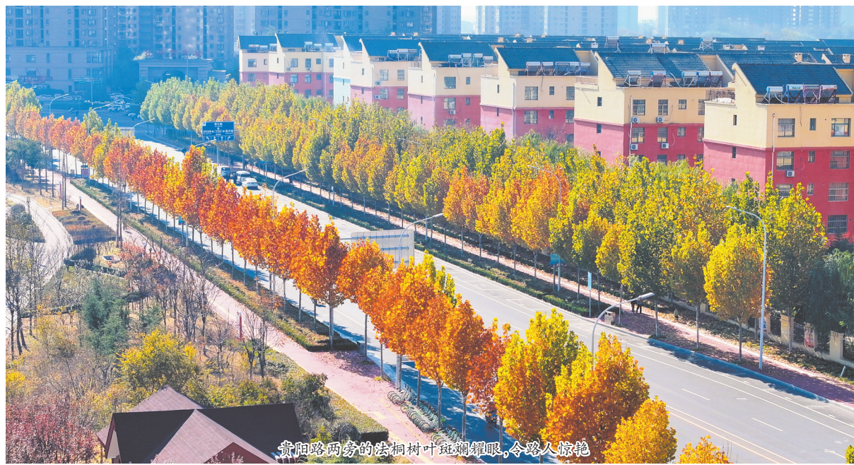
贵阳路两旁的法桐树叶斑斓耀眼,令路人惊艳