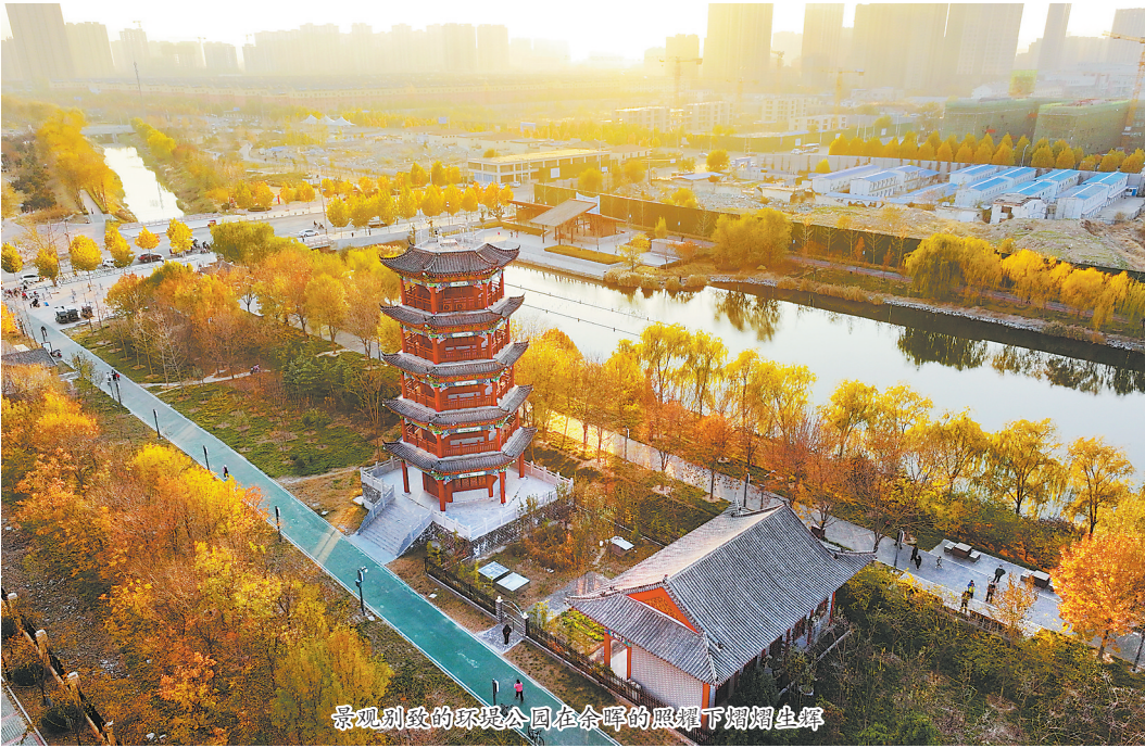
景观别致的环堤公园在余晖的照耀下熠熠生辉