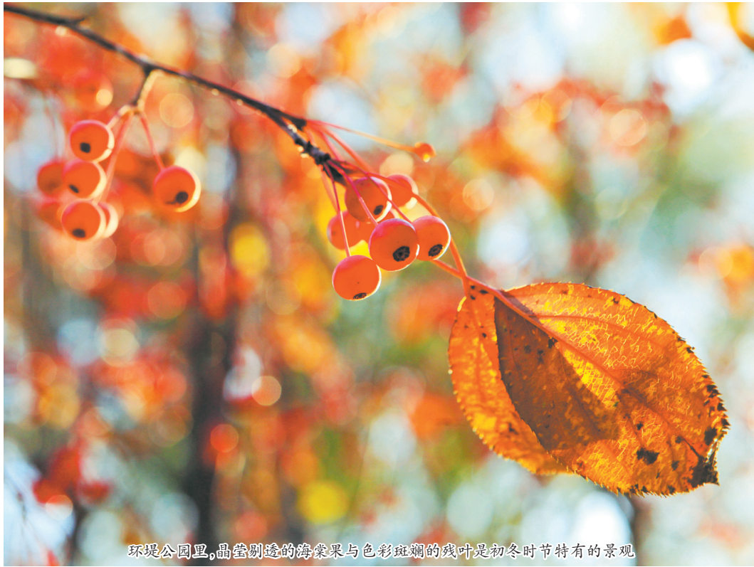
环堤公园里,晶莹剔透的海棠果与色彩斑斓的残叶是初冬时节特有的景观