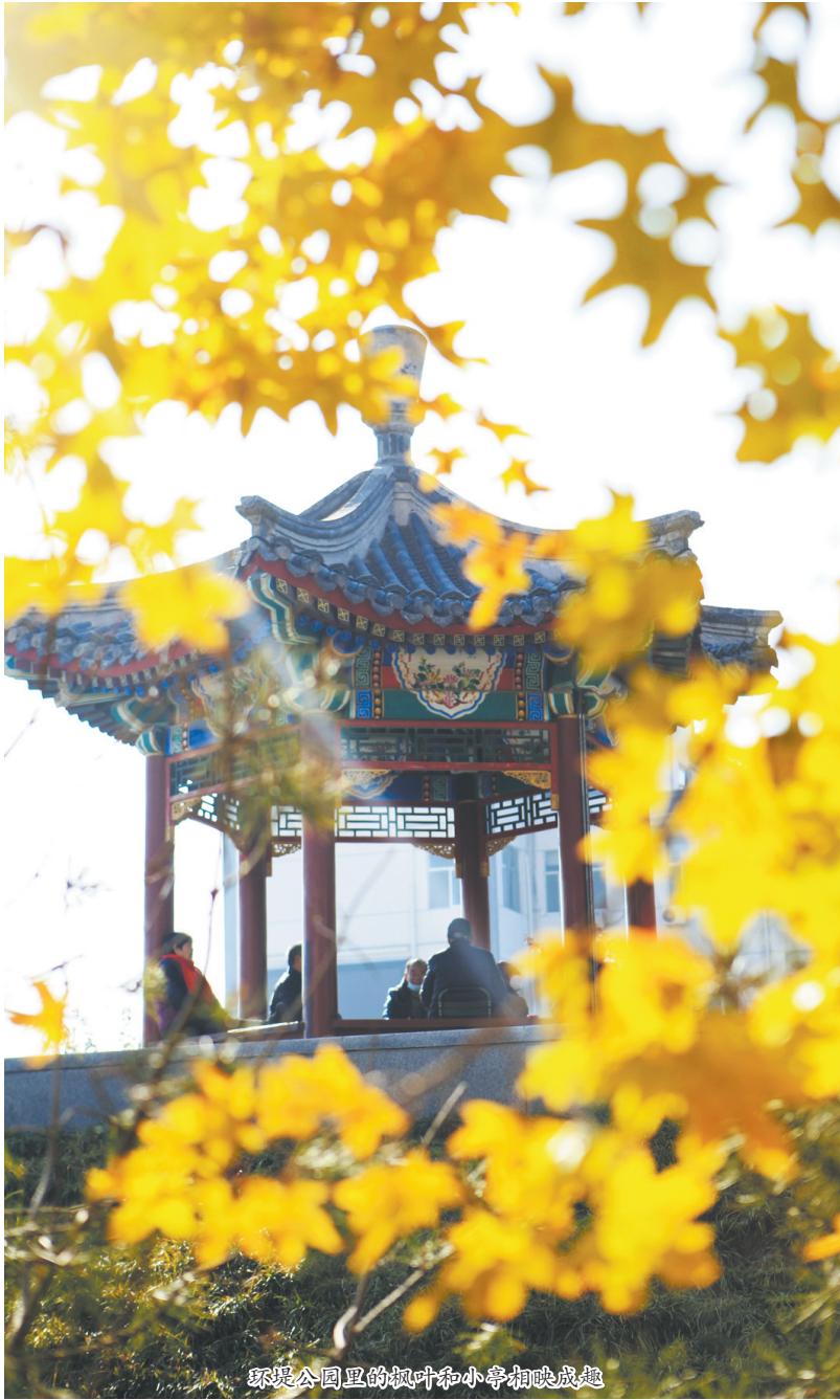
环堤公园里的枫叶和小亭相映成趣