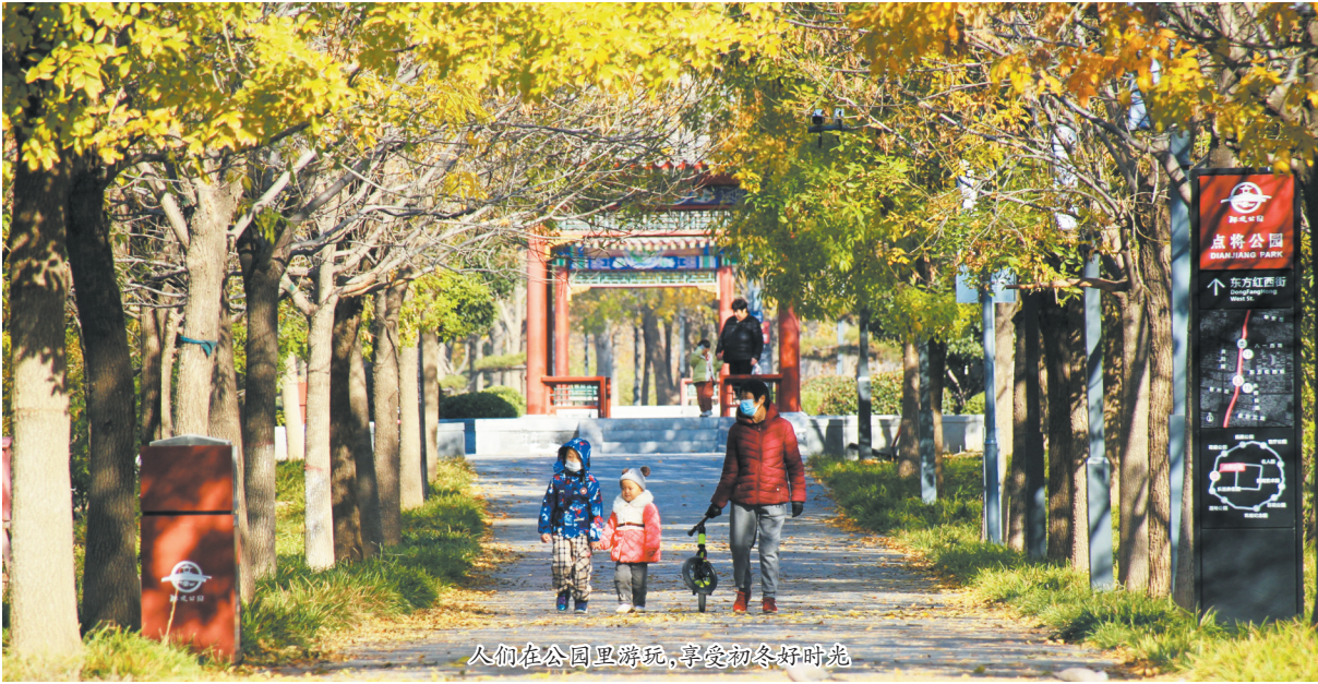
人们在公园里游玩,享受初冬好时光