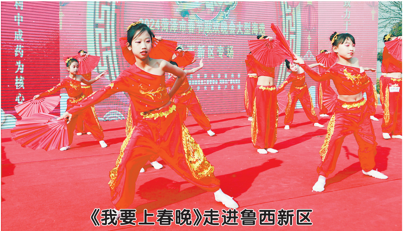
▲12月9日,2024菏泽市春节联欢晚会大型海选鲁西新区专场举行。海选活动以多场景、多角度、多手段呈现,兼具时代性、趣味性、艺术性,为全区群众搭建了一个展示才艺的大舞台。歌曲、舞蹈、戏曲、武术、情景剧、乐器演奏等50余个节目逐一登场,展示出新区居民对生活的热爱,进一步激发和鼓舞全区上下踔厉奋进、争创伟业,全面展示了鲁西新区文化艺术的丰硕成果。