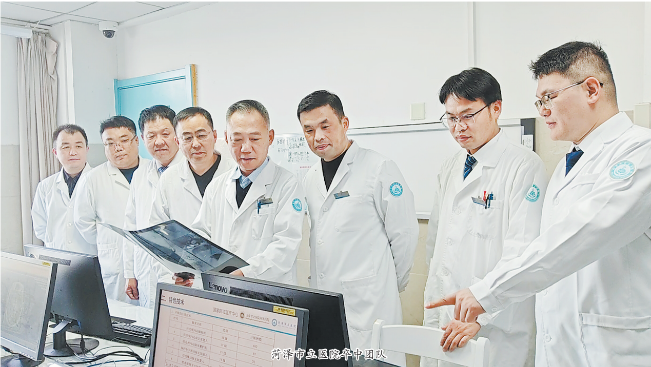
菏泽市立医院卒中团队

菏泽市立医院“急性缺血性卒中介入再通专科”被评为“2023 年度山东省临床精品特色专科”