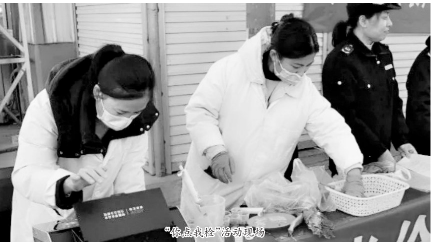
“你点我检”活动现场

“食品安全是民生工程、民心工程，关系到千家万户的幸福平安。”活动现场负责人介绍，下一步，巨野县市场监督管理局将以此次宣传活动为契机，持续扩大宣传活动的覆盖面和影响力，进一步提高群众食品安全素养，营造同心协力守护全县食品安全的浓厚氛围。