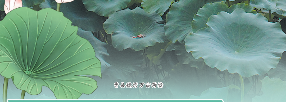
曹县魏集万亩荷塘