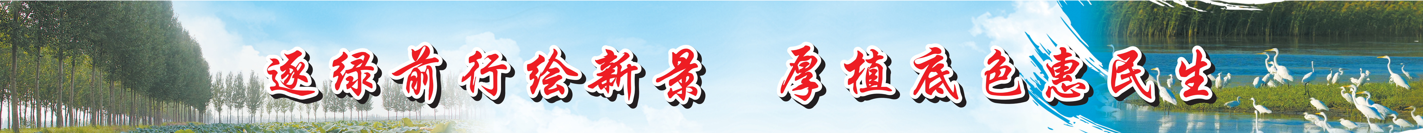
东明黄河国家湿地公园