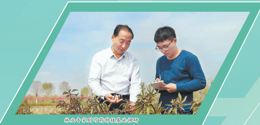
林业专家到菏泽林地进行调研