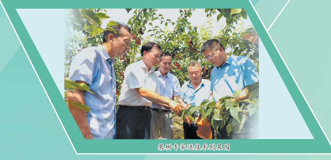
临沂专家进技术到菜园