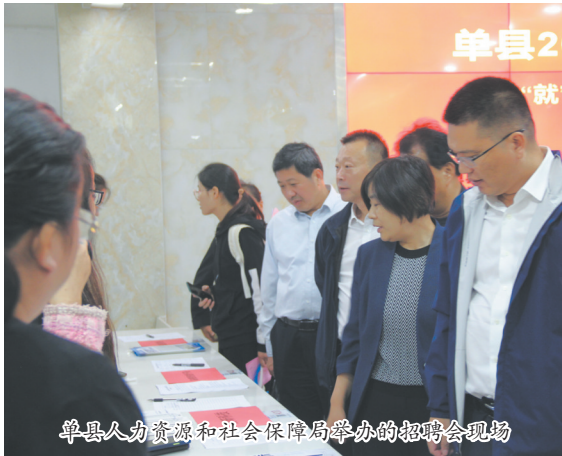
单县人力资源和社会保障局举办的招聘会现场

充分发挥创业带动就业成效，累计发放创业担保贷款1.5亿元，惠及1000多名创业者和7家小微企业，累计带动就业3000多人。全面开展线上线下招聘活动，连续举办服务业、制造业等多个专场招聘活动，为各类求职者与企业提供供需对接服务，已举办招聘活动30余场，提供就业岗位1.6万个。全力用好“山东一名校人才直通车”“2023菏泽高校毕业生双选会”等重点平台，组织企事业单位奔赴长沙站（中南大学）、重庆站（重庆大学）、济南站（长清大学城）、西安站（西安医学院）等4地进行高层次人才招聘，现场与20余名高层次人才签约意向协议。积极参加市委组织部、市人社局举办的“2023菏泽高校毕业生双选会”活动，提供就业岗位579个，企业达成就业意向133人。全力提升职业技能培训水平，提升劳动者就业技能；全面推进企业人才技能评价，激活企业技能人才。