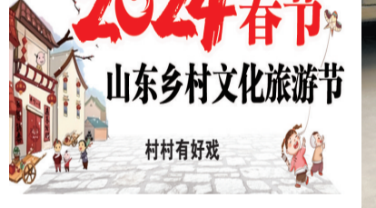
2024春节 山东乡村文化旅游节 村村有好戏