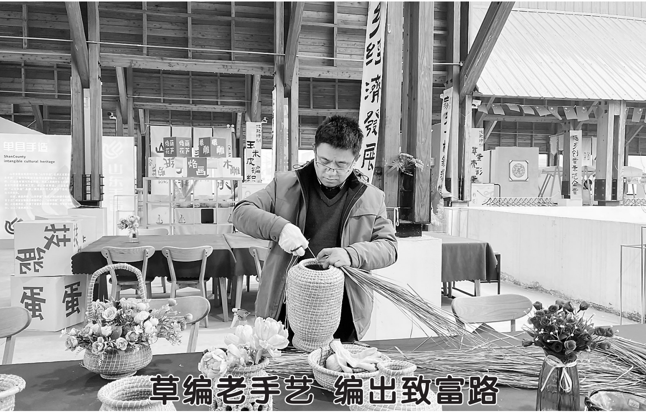
草编老手艺 编出致富路

执法配套制度等行政执法规范化建设,确保赋权工作稳妥、有序推进。 坚持先行试点、逐步推开,我省拟在全省范围内选择20个左右县(市、区)所辖全部乡镇(街道)开展试点,为下一步在全省面上推开探索积累经验。具体试点范围,由各市推荐1至2个县(市、区)报省委编办、省司法厅研究确定。 《指导目录》以表格形式逐项明确了事项编码、事项名称、设定行使依据、原实施主体4项要素,明确为试点县(市、区)所辖乡镇(街道)下放交通运输、农业农村、城乡建设管理、自然资源、应急管理、水务6个领域106项赋权事项,涉及行政处罚(100项)、行政强制(6项)两类行政权力。 转自《大众日报》刘一颖