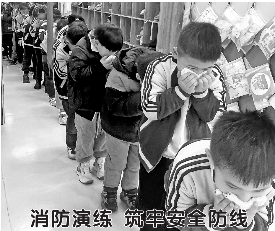
消防演练 筑牢安全防线

据统计,曹城街道累计投资860万元,美化墙体8.6万平方米,修补残墙330余处,新修下水道1万余米,硬化路肩2万平方米,栽植绿化树木2.6万余棵,整修路沟18条、坑塘21处,治理黑臭水沟6条,清理“五堆”630余处;新建村内微型景观12处、休闲文化公园3处、停车场4处、民宿1处、网红打卡地8处,安装景观雕塑7处等,绘就一步一景、一路一观、一村一特色的乡村风情图画。