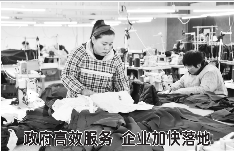
政府高效服务 企业加快落地

菜种植大棚内,专家同样为种植户现场传授先进技术和经验,指导他们做好西红柿的病虫害防治等生产关键环节。除实地指导外,岳程街道还邀请农机专家现场授课,现场解决农户提出的问题,促进农业技术创新和推广应用,全力做好春耕备耕工作。