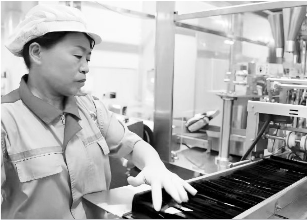
近日,在位于鲁西新区的菏泽佳诺佳宠物用品有限公司车间里,工人正在生产线上赶制来自欧洲的订单。该公司是一家集宠物用品研发、生产、销售和服务于一体的综合性企业,拥有多项国家级发明专利,产品出口遍及欧美、新加坡、中东等国家和地区。

下一步,吕陵镇将持续开展创建文明城市专项整治行动,不断提升群众对创城工作的认同感和共建美好家园的归属感,真正做到创建为民、创建惠民、创建利民。