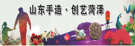
山东手造·创艺菏泽