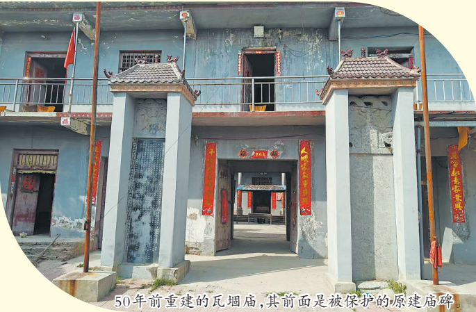
50年前重建的瓦庙店，其前面是被保护的原建庙碑

堆烂瓦砾碎之中。惶恐之时，刘邦暗自祈祷：“神庙护佑，吾若避此劫难，定要重修庙宇、再塑金身，报以洪恩！”