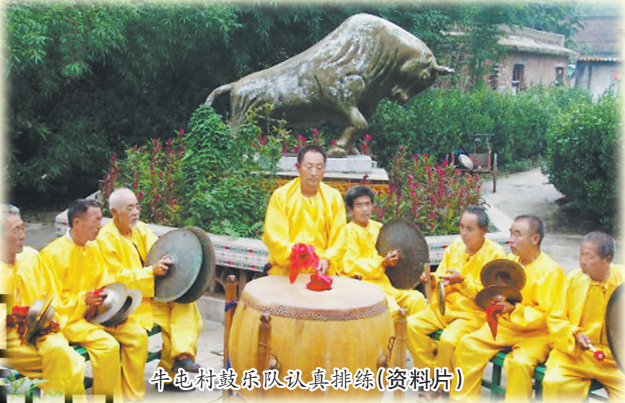
牛屯村鼓乐队认真排练(资料片)

定陶区孟海镇牛屯村，是一个古老而又有着丰厚历史文化积淀的村庄。牛屯鼓乐是山东鼓乐的重要流派，是一种以鼓为主要演奏乐器的民间艺术形式。牛屯鼓乐主要分布于菏泽定陶及周边地区。