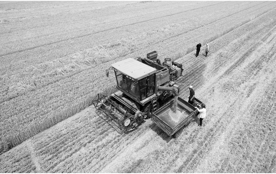
6月6日,联合收割机在山东省聊城市茌平区贾寨镇贾寨前村田间收获小麦(无人机照片)。 当前,冬小麦机收正由南向北加快推进。截至6月5日,全国各地冬小麦已收1.9亿亩、收获进度57%,比去年同期快17.7个百分点。