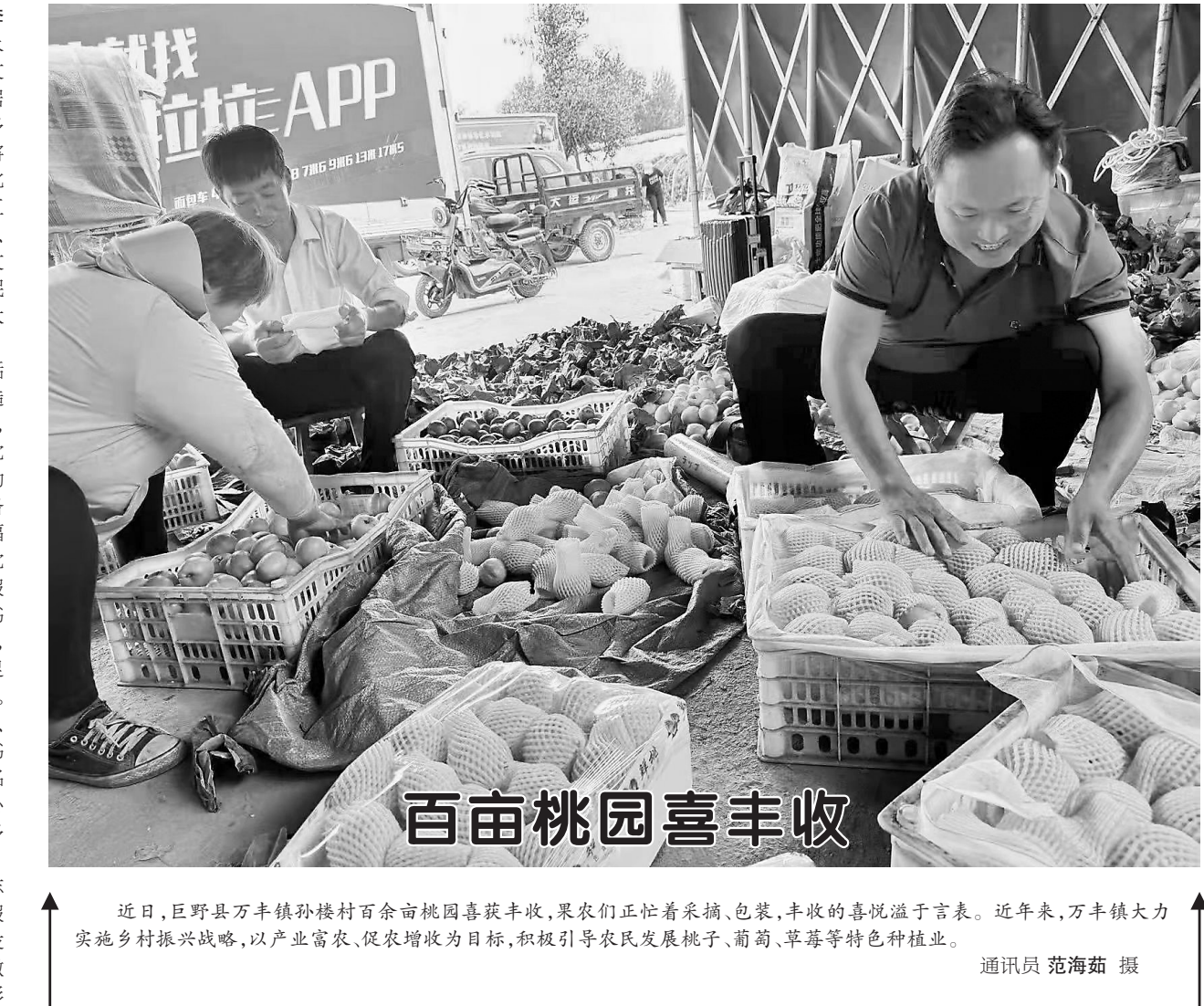
近日，巨野县万丰镇孙楼村百余亩桃园喜获丰收，果农们正忙着采摘、包装，丰收的喜悦溢于言表。近年来，万丰镇大力实施乡村振兴战略，以产业富农、促农增收为目标，积极引导农民发展桃子、葡萄、草莓等特色种植业。

巨野县永丰街道：打造多元文化社区 创建和美「永丰」家园 本报讯（记者 李萍）近年来，巨野县永丰街道坚持以社区文化建设为抓手、以居民需求为导向、以多样化服务为支撑，将城市精准化、精细化治理作为城市社区工作的突破口，强阵地、扬新风、建队伍，以文化人、以文聚心，居民的幸福感、满意度大幅提升。 建强文化社区活动阵地。高标准打造社区党群服务中心，设置便民服务区、党建活动室、文体活动区等服务区域，配备便民服务大厅、小福学堂、红色读书角、党员活动室、志愿者服务站、健身舞蹈室、书画室等17个功能室，丰富文化供给，满足群众多元文化需求。高标准打造了永丰、会盟两个社区城市书屋，能满足8000余名居民阅览图书、爱心托管、健身休闲等多元化“点单”需求。 壮大文化社区志愿队伍。落实志愿服务招募注册、项目发布、服务记录、褒奖激励等制度化建设，形成“1+1+N”志愿服务队伍体系，8支社区志愿服务团队、1260名志愿者活跃在文明实践第一线，让志愿服务“人人可学、处处可为、时时可见”，真正做到为民办实事、鼓干劲、解难题。依托市级理论宣讲基地集聚优势，充分挖掘、培养不同年龄阶段及各行业领域宣讲人才，建立了一支政治强、业务精、作风优良的宣讲队伍，梳理储备骨干宣讲员、文艺能手145人。创新“理论+文艺+服务+网络”模式，将理论学习融入山东快书、快板、二夹弦等文艺表演，组织“党的二十大精神记心间”“祖国，我想对你说”等“理论宣讲+文艺汇演”活动890场次，惠及群众13000余人。 弘扬文化社区文明新风。利用重大节假日，结合“黄河大集”，组织“小村长”“小街长”“小楼长”，网格员开展“奋进新时代 志愿在行动”“共上思政课 同心育新人”“端午粽子宴”等文明实践活动，传递社会正能量。围绕“五为”文明实践志愿服务，培育出“爱心助学”“孝老爱亲”“帮扶先锋”“俏红娘”等一批群众喜欢、感染力强、影响力大的文明实践品牌项目。连续数年为360余名大学生、318位90岁以上老人、560余户困难党员发放助学金、慰问金。为369名孤寡老人设置暖心“1号键”，为130户低收入家庭提供工笔牡丹画免费培训，着力弘扬崇德向善、扶贫济困、孝老爱亲的良好风尚。