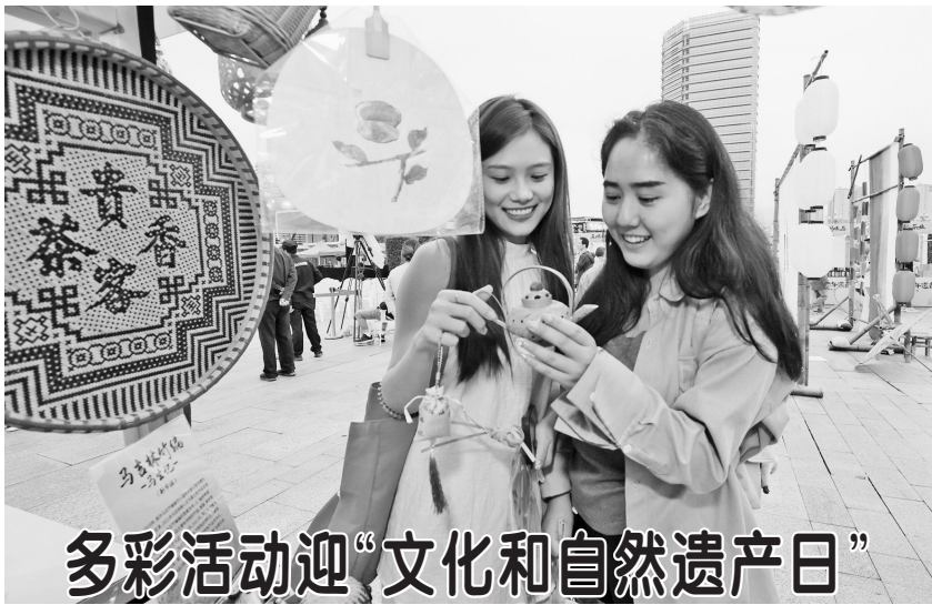
6月6日，市民在浙江省湖州市德清县地理信息小镇“非遗市集”欣赏非遗文创作品。6月8日是2024年的“文化和自然遗产日”，各地开展丰富多彩的活动。

检察机关在审查起诉阶段依法告知了被告人郑学林享有的诉讼权利，并讯问了被告人，听取了辩护人的意见。检察机关起诉指控：被告人郑学林利用担任最高