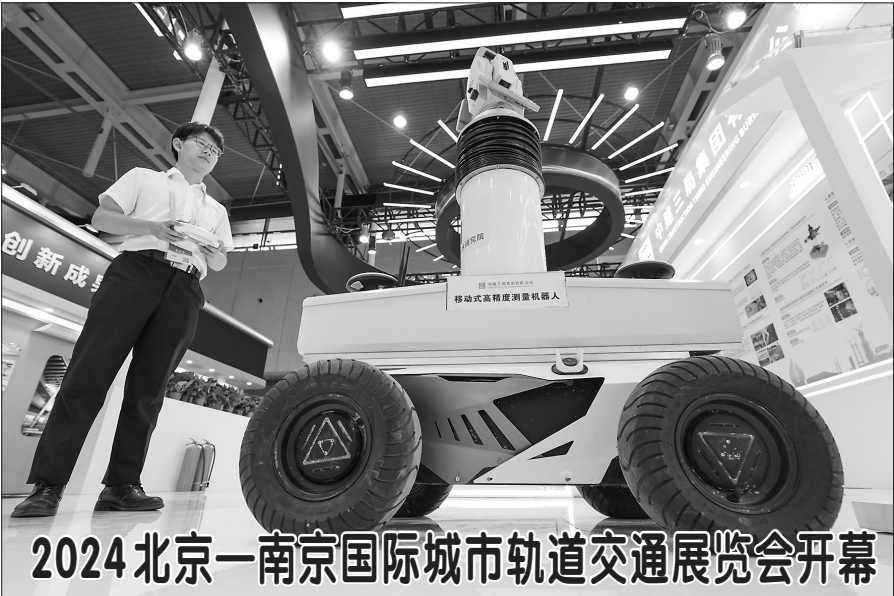
2024北京—南京国际城市轨道交通展览会开幕

中国人民银行近期宣布设立3000亿元保障性住房再贷款。该项目旨在盘活存量房产的再贷款进展怎样、如何运作,各方高度关注。 记者了解到,金融管理部门即将印发具体实施规定,明确监管政策和操作流程,“政府指导、市场化运作”“自愿参与、以需定购、合理定价”成为需要关注的关键词。 以市场化方式推动存量商品房去库存 “设立保障性住房再贷款,有利于通过市场化方式加快推动存量商品房去库存,加大保障性住房供给,助力推进保交房工作及城市房地产融资协调机制。”在中国人民银行日前召开的保障性住房再贷款工作推进会上,中国人民银行行长潘功胜一语点出此次保障性住房再贷款的意义所在。 就在上个月,中国人民银行宣布拟设立3000亿元保障性住房再贷款,鼓励引导金融机构按照市场化、法治化原则,支持地方国有企业以合理价格收购已建成未出售商品房,用作配建型或配租型保障性住房,预计带动银行贷款5000亿元。 记者注意到,与此前3500亿元保交楼专项借款政策相比,这次的保障性住房再贷款更为强调“政府指导、市场化运作”,并明确了“自愿参与”的要求,尊重各方参与主体的意愿。 “城市政府应综合考虑当地情况自主决定是否参与;符合保障条件的工薪群体可根据项目的区位、品质、价格,自愿选择是否参与配建配租。”中国人民银行货币政策司司长邹澜介绍。 他表示,房企结合自身资金压力与收购价格谈判情况等,自主决定是否出售商品房,不能强买强卖;金融机构按照风险自担、商业可持续原则,自主决定是否向地方国企发放相关贷款。 据介绍,金融机构发放相关贷款后,可向人民银行申请再贷款,先到先得,额度3000亿元,未来根据执行情况和需要可调整完善。再贷款年利率1.75%,期限1年,可展期4次,每次展期1年,最长使用期限不超过5年,政策实施至2027年末。 业内人士认为,具体操作中,地方国企和金融机构风险自担,核心是要确保商业可持续。 以需定购确保政策落地见效 如何从机制上确保3000亿元保障性住房再贷款政策落地见效?对此,中国人民银行要求各地以需定购,做到收购主体、