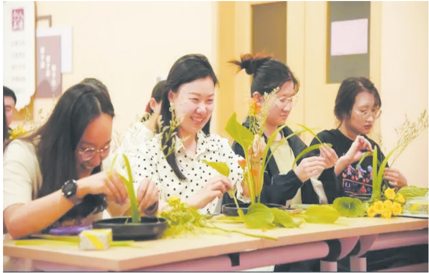
▲2024年5月28日,在江苏省南京市鼓楼区宁海路街道党群服务中心,鼓楼区青年夜校学员体验插花课程。

夜校的举办主体大致可分为三类。一是文化馆、共青团、工会、妇联等公共机构,提供低价甚至免费的公益性夜校课程。二是高校继续教育学院、职