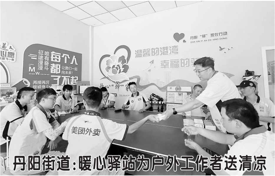
丹阳街道:暖心驿站为户外工作者送清凉 ▲6月14日15时许,位于鲁西新区丹阳街道中山路的丹心“驿”家暖心驿站内,外卖骑手正在歇脚、纳凉,有关人员正在为他们发放防暑降温物品。据悉,丹阳街道在辖区万达商圈、剑桥学府、恒丰银行等处及各社区内共设立56个暖心驿站,站内配套空调、饮水机、微波炉、应急药箱等便民设施,为快递小哥、外卖骑手、环卫工人、建筑工人等户外工作者提供一个“渴了能喝水、热了能乘凉、冷了可取暖、累了能休息”的共享空间。