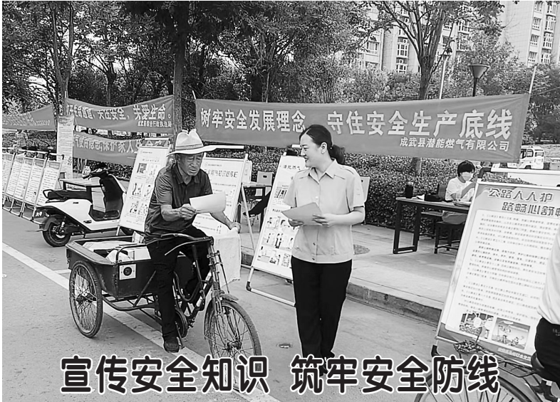
宣传安全知识 筑牢安全防线 ▲6月是全国第23个安全生产月,今年的主题是“人人讲安全、个个会应急——畅通生命通道”。6月14日上午,成武县公路事业发展中心在县城红旗广场开展“安全至上、人人有责”宣讲活动,旨在提升公众的安全生产意识,传播安全知识,筑牢安全生产防线。活动通过摆放宣传展板、发放资料和现场讲解的方式向群众传递安全生产知识,并解答群众关心的公路安全问题,营造“安全至上、人人有责”的社会氛围。