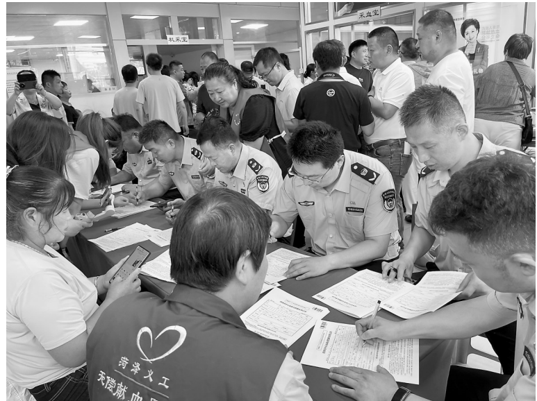
菏泽市生态环境局牡丹区分局工作人员集体参加无偿献血