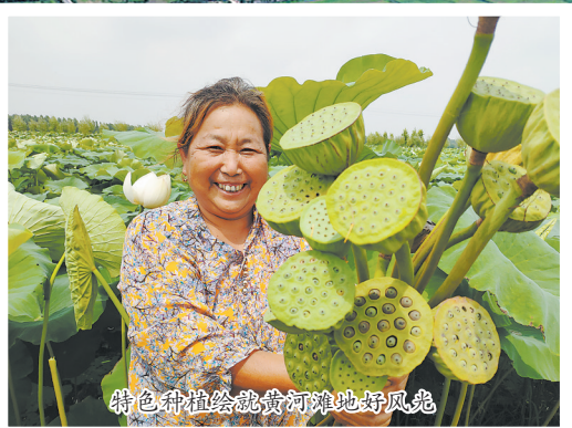
特色种植绘就黄河滩地好风光