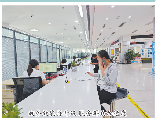
政务效能再升级 服务群众加速度