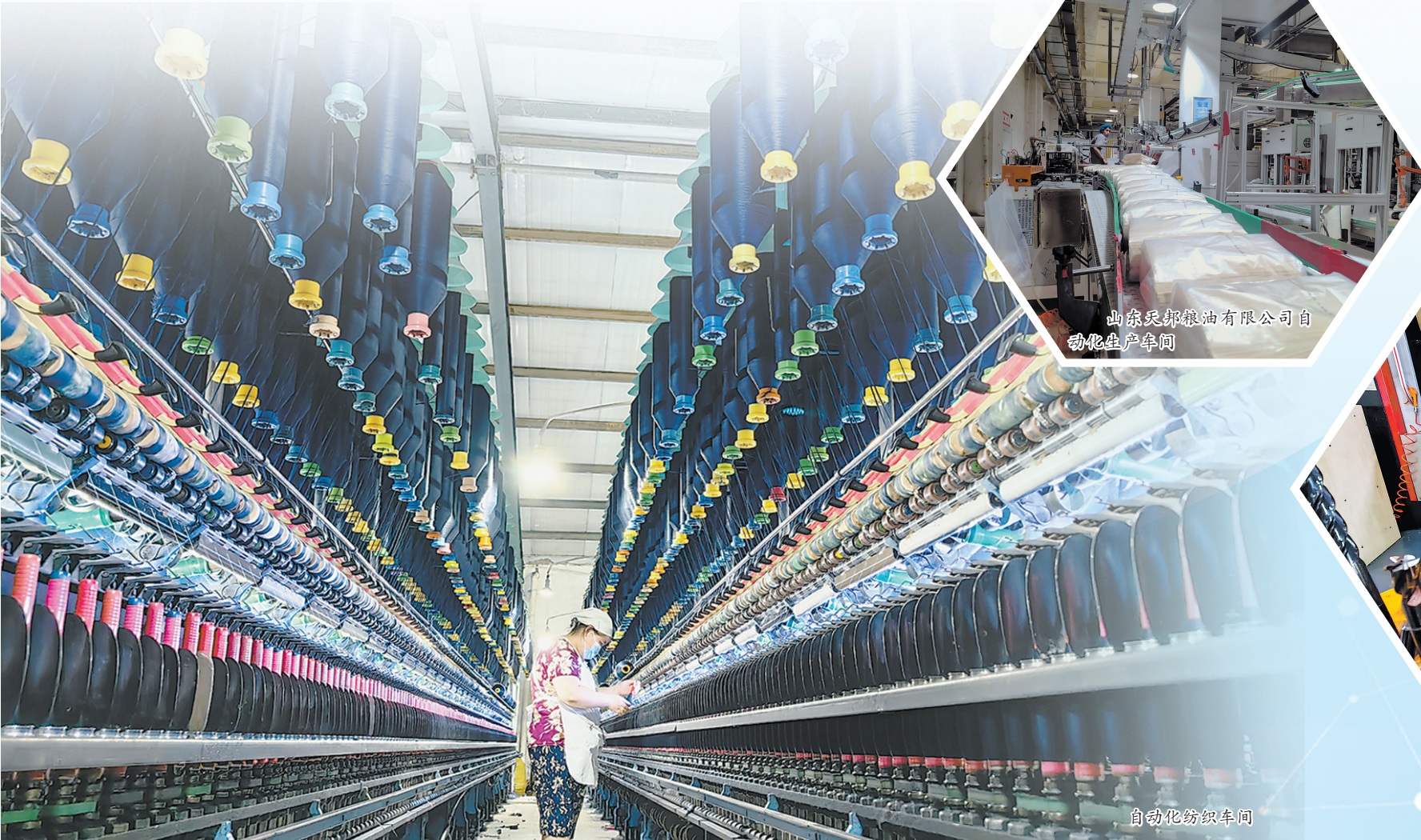
山东天邦粮油有限公司自动化生产车间