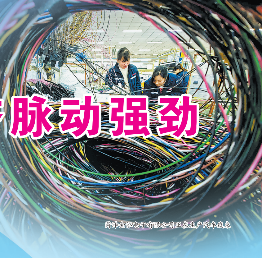
菏泽金泓电子有限公司正在生产汽车线束

2024年上半年,牡丹区规模以上工业增加值增长12.7%,工业税收增长19.98%;新增“省级专精特新企业”17家,入库科技型中小企业35家,新增高新技术企业25家,新增数量位于全市第一。亮眼数据彰显出全区工业生产之“稳”,产业优化升级之“进”。近年来,牡丹区在市委、市政府的坚强领导下,深入推进工业高质量发展,坚定不移实施“工业强区”战略,积极融入全市“231”特色产业体系的同时,聚焦聚力工业“二次创业”,推动传统产业提质增效、新兴产业培育壮大,全面夯实工业发展根基。