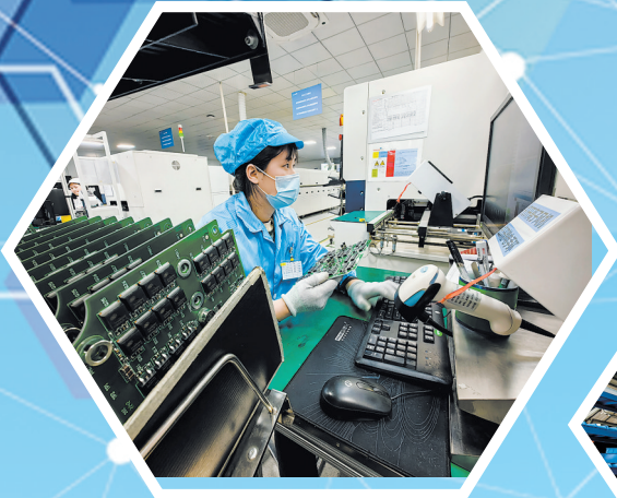
电子主板生产车间