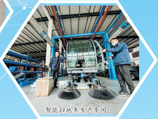
智能扫地车生产车间

2024年上半年,牡丹区规模以上工业增加值增长12.7%,工业税收增长19.98%;新增“省级专精特新企业”17家,入库科技型中小企业35家,新增高新技术企业25家,新增数量位于全市第一。亮眼数据彰显出全区工业生产之“稳”,产业优化升级之“进”。近年来,牡丹区在市委、市政府的坚强领导下,深入推进工业高质量发展,坚定不移实施“工业强区”战略,积极融入全市“231”特色产业体系的同时,聚焦聚力工业“二次创业”,推动传统产业提质增效、新兴产业培育壮大,全面夯实工业发展根基。