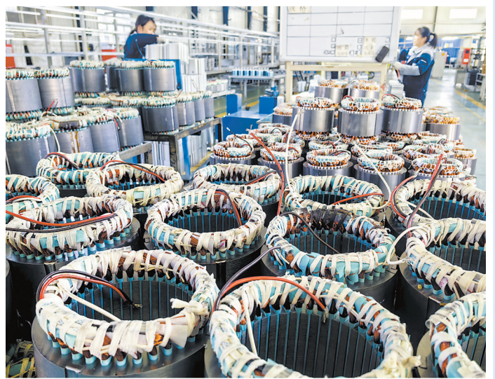
高峰电机生产车间

精特新“小巨人”企业1家、制造业单项冠军企业1家,新增规模以上工业企业25家、“专精特新”中小企业10家,全年在库技改项目达到20个,技改投入增长10%以上。同时,牡丹区围绕主导产业和重点项目引进国有资本和社会资本,组建创业投资基金,助推重点产业项目加快落地建设。用好“增存挂钩”政策,建立完善批而未供土地分布一张图,加速处置闲置低效用地。充分发挥牡丹经济开发区主阵地作用,优化产业布局,增强承载能力。下一步,牡丹区将锚定“工业强区、二次创业”发展战略不变,立足本地资源禀赋和区域优势,把重点产业发展作为推动工业经济高质量发展的重要引擎,力促全区工业转型升级和提质增效,聚力推动工业高端化、智能化、绿色化发展。