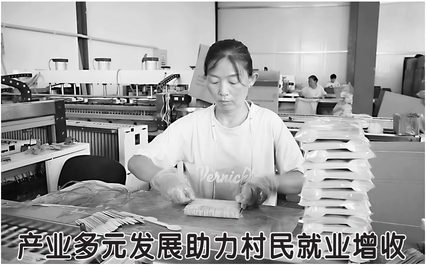
产业多元发展助力村民就业增收 8月13日，东明县长兴集乡王高寨村的致富车间内，工人正忙着包装木质餐具。据了解，长兴集乡积极响应群众需求，不断加大乡村就业工厂和致富车间扶持力度，成功引入了木质餐具生产、玩偶制作及吨包加工等多元化产业项目，为当地群众创造了就业机会，有效推动了地方经济的快速增长。