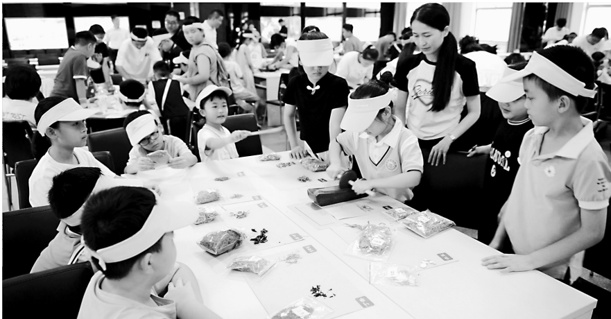
医药传统文化知识，激发了学生们了解中医药、热爱中医药的热情。 山东步长医药产业园借用现有工业旅游平台资源优势，利用工业旅游与中医药文

本报讯（记者 刘兰英）为弘扬中华优秀传统文化，让更多青少年了解中医药、走近中医药，培养其热爱祖国优秀传统文化，增强青少年文化自觉和文化自信，提升中华优秀传统文化的影响力，日前，共计200余名中小学生到山东步长医药产业园研学基地开展“与步长一起 共探中药之美”暑期研学活动。 活动中，山东步长医药产业园工作人员带领学生们体验各种实验过程，并参与趣味小实验，了解药品检验的奥妙。在山东步长智能制造生产现场，学生们了解了“中草药”变“药品”的生产过程和中药药食同源相关知识，认识生活中常见的中药材，体会中医的博大精神，以及中医、中药材与日常生活的关系。学生们还通过望、闻、问、触辨识百草，在老师的指导下，动手制作中医药香囊。学生们还参观了山东步长“毛泽东主席像章纪念馆”。 通过此次研学，学生们进一步了解了中