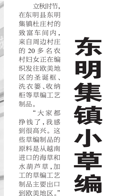
东明集镇小草编带动就业四千余人 立秋时节，在东明县东明集镇杜庄村的致富车间内，来自周边村庄的20多名农村妇女正在编织发往欧美地区的圣诞帽、洗衣篓、收纳柜等草编工艺制品。 “大家都挣钱了，我感到很高兴。这些草编制品的原料是从越南进口的海草和水葫芦草，加工的草编工艺制品主要出口到欧美地区。”该加工点负责人袁艳红介绍，2014年她到义乌找项目，觉得加工草编工艺制品投资少，又环保，很适合在家乡发展。刚开始是自己做，后来亲戚朋友都跟着做。现在不仅带动了全镇村庄的家庭妇女和老人做草编，还辐射到河南省的濮阳、滑县、长垣、开封、兰考等地，现有草编工艺品加工点50多个，带动低收入群体就业4000多人。 吉利营村村民李四党说：“我家离这七八里地，做草编比较自由，农忙时种地，农闲时就在这干活，一个月能挣2000多块钱。” 近年来，东明集镇党委、政府精准施策，以产业兴旺推动乡村全面振兴，成为乡村振兴新动力，把闲置场地改造成生产车间和工厂，让手工艺品加工企业入驻，带动农村闲散劳动力实现“家门口”就业。“我们村里的草编加工点平时有几十个工人，都是村里不能外出务工的妇女，既不耽误照顾家里的老人和小孩，每天还能挣六七十块钱，年龄大一点的老人也能干，解决了农村闲散劳动力的就业问题，也给村民增加了收入。”东明集镇袁长营村会计刘红杨说。 通讯员 侯晓娟 宋付昌

经济’。”赵文双介绍，我们注册了“盛世芍韵”商标，着力打造本土芍药品牌，同时根据芍药鲜切花数量精心设计不同风格的包装盒，高品质的芍药鲜切花，让企业接到了来自全球的众多订单。 营商环境是企业生存发展的土壤，芍药鲜切花产业蓬勃发展的背后，离不开牡丹区营商环境的持续优化。 “新冠疫情期间，种苗销售受限，都司镇政府为我们减免了一部分租金，帮助我们渡过了难关。”赵文双表示，2022年，在企业急需资金时，牡丹区项目服务专班及时送政策上门，经过沟通协调，成功帮助企业申请了800万元贷款，而且贷款利率低了一个百分点，极大减轻了企业负担。 芍药鲜切花具有花大色艳、插花期长的特点，花开之后最大直径可达23厘米。