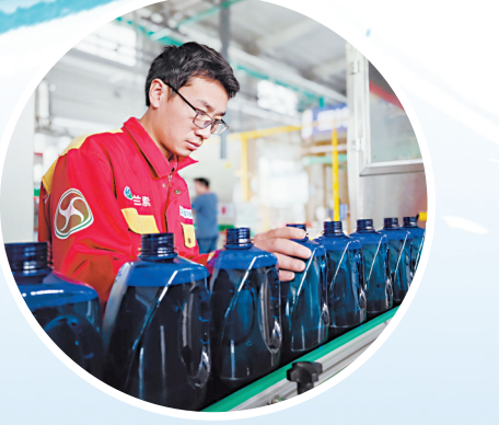
▲鄄城龙瑞科技车间内，工人正在加紧生产