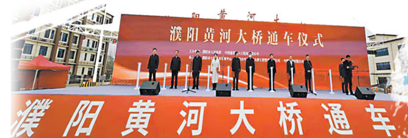
▲菏泽至濮阳新建黄河大桥通车仪式现场