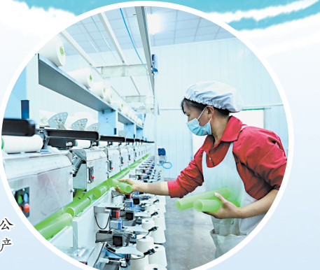
▲华源纺织有限公司车间内，工人正在生产线上忙碌