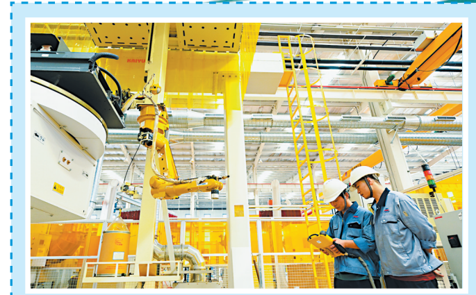
▲河南巨源精密机械科技有限公司新能源装备关键零部件项目生产车间内，工人正在忙碌着。该项目总投资10亿元，可年产新能源汽车、风电、核电、光伏设备、航天航空领域零部件1500万件