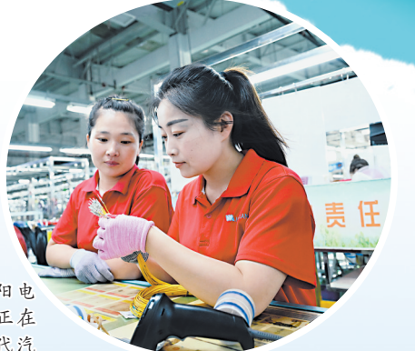
▲濮阳市汉阳电子有限公司员工正在加紧完成韩国现代汽车公司的订单