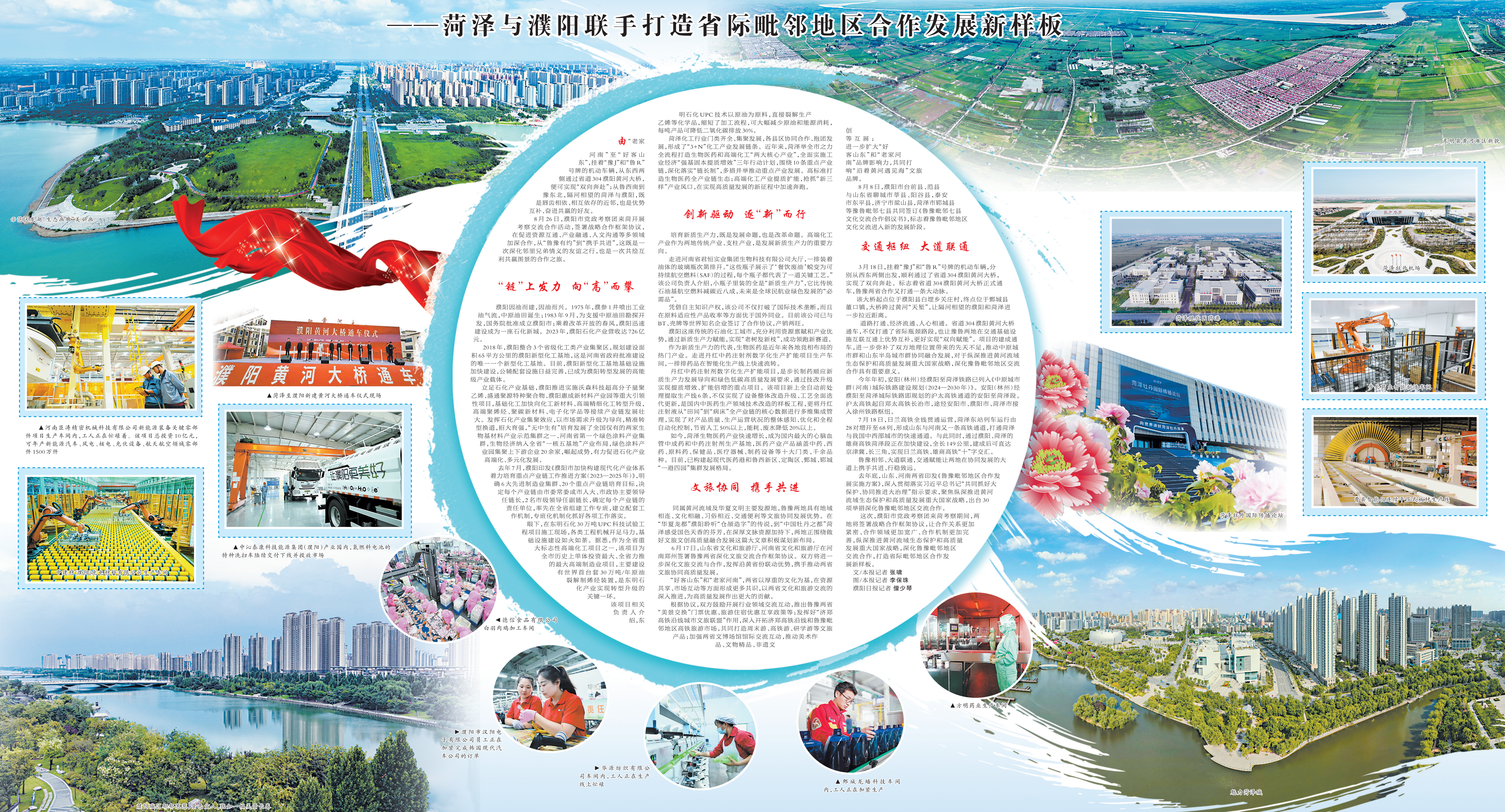
帝苑区“南湖”生态画廊“美丽河湖”