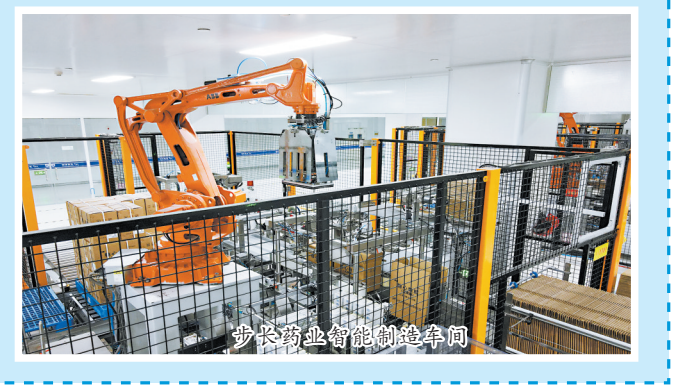
菏泽市经济开发区