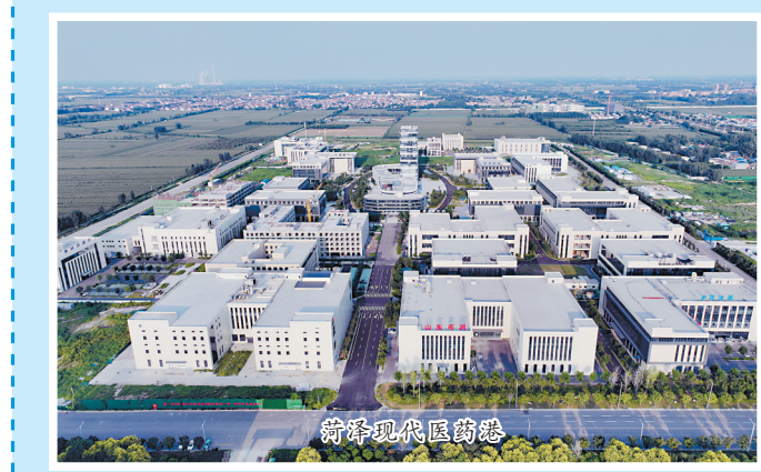
菏泽市经济开发区