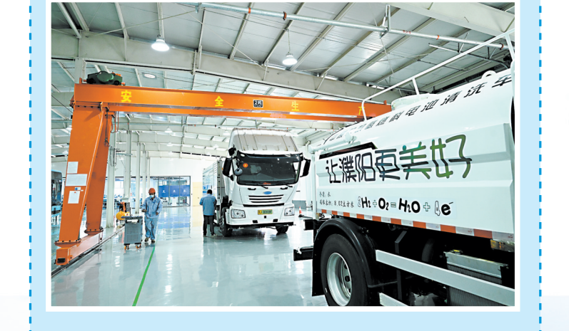
▲中沁泰康科技能源集团(濮阳)产业园内，氢燃料电池的特种洗扫车陆续交付下线并投放市场