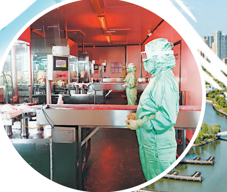
▲方明药业生产车间