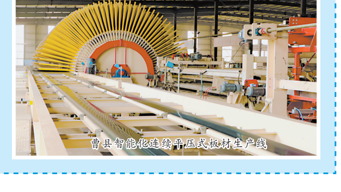
菏泽市经济开发区