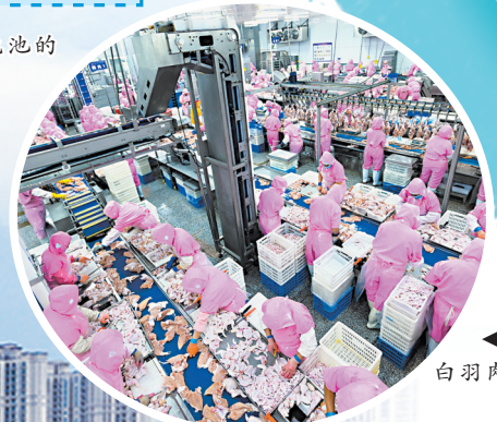
▲德信食品有限公司白羽肉鸡加工车间