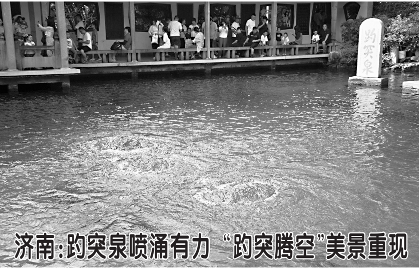
8月24日，游客在观赏趵突泉。 近日，受降雨影响，位于山东省济南市的趵突泉地下水位上升到28.70米以上，泉水喷涌有力，“趵突腾空”美景重现。

8月24日拍摄的杰玛央宗冰川（无人机照片） 西藏日喀则市仲巴县境内的杰玛央宗冰川，是“西藏母亲河”雅鲁藏布江的发源地。这里海拔高、气候干燥、雨水稀缺，曾经风沙肆虐。近些年，当地采取人工种草、退牧还草等措施，雅江源头周边地区的沙化问题得到有效缓解。壮美冰川滋养着周边的湿地与草场，为野生动物提供了舒适的栖息地。