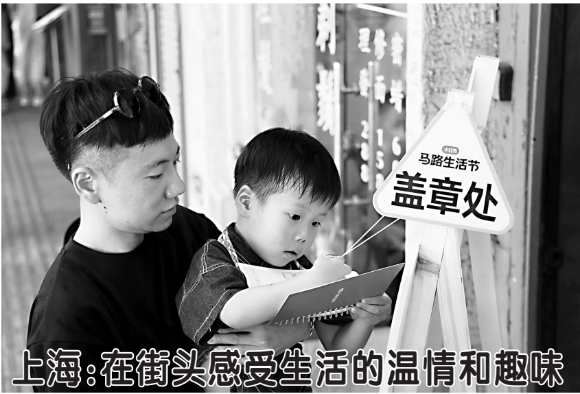
上海：在街头感受生活的温情和趣味 8月24日，小朋友在上海淡水路参与“马路生活节”集章活动。8月23日至9月1日，第二届“马路生活节”在上海举行。活动以“来街头和快乐接头”为主题，在上海街头呈现超200场主题活动，包括吹吹风市集、落日音乐会、小马路逛吃玩之旅等，让人们感受生活里的温情和趣味。 新华社发

李强表示，机器人体现了各种现代技术的综合集成，融合了人工智能、新材料、生物仿生等新兴科技新产业，是衡量科技创新和高端制造水平的重要标志。我们要面向产业转型和消费升级需求，瞄准国际前沿进展，推进机器人技术革新，持续强化基础研究和核心技术攻关，支持创新载