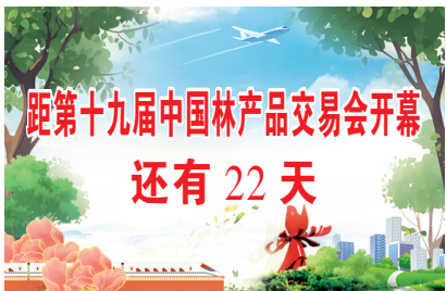
距第十九届中国林产品交易会开幕 还有 22 天

下一步，牡丹区将着力打造一批融入生活、群众喜爱的婚育工作品牌，大力倡导新型婚育文化，进一步引导群众树立积极婚育观念，促进人口高质量发展，构建生育友好社会。