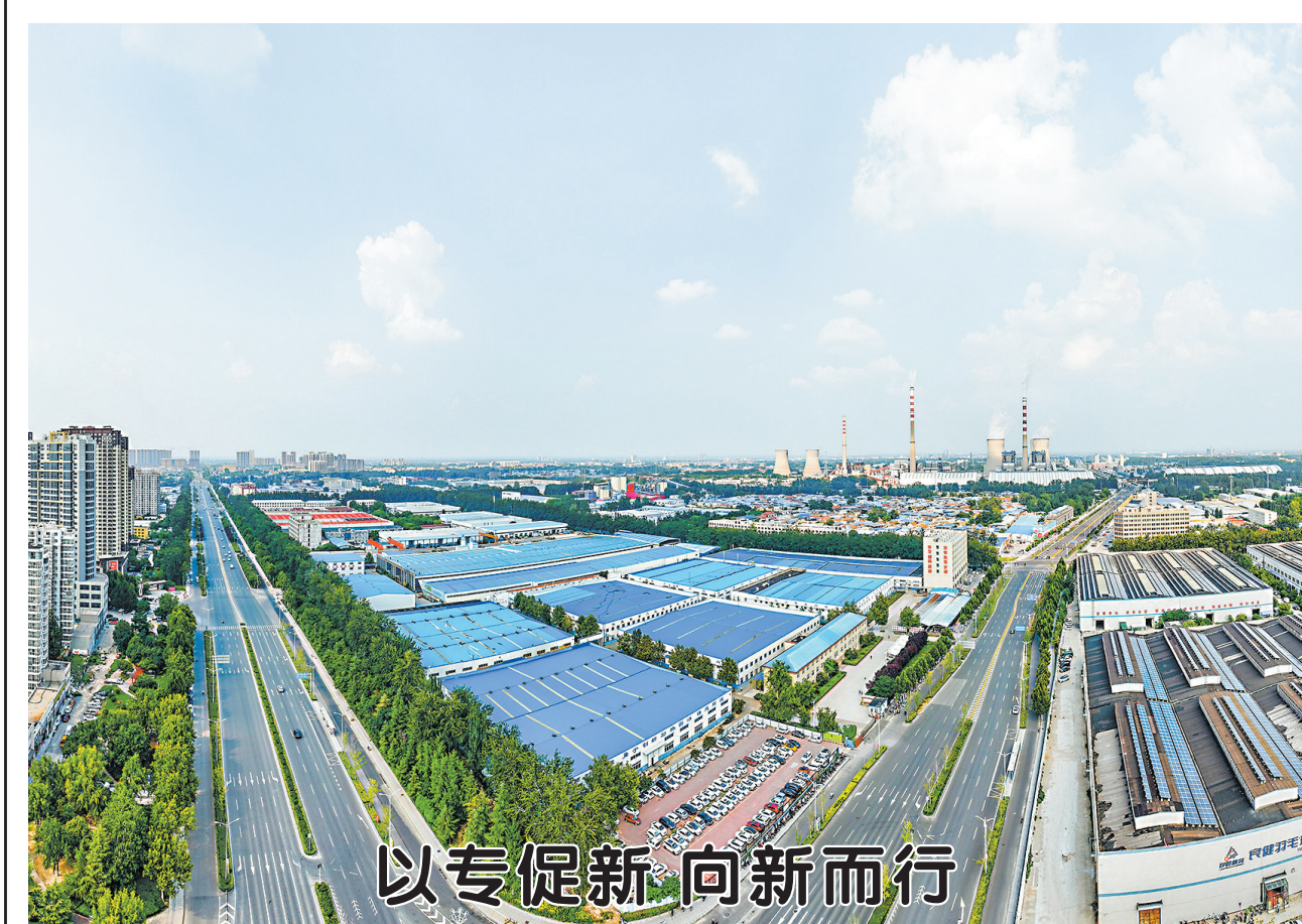
以专促新 向新而行