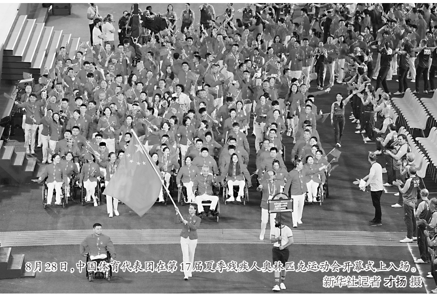
8月28日,中国体育代表团在第17届夏季残疾人奥林匹克运动会开幕式上入场。新华社记者 才扬 摄

新华社巴黎8月28日电 (记者 郑直 肖亚卓)巴黎奥运会的余温尚未散去,法兰西的夏天又迎续篇。第17届夏季残疾人奥林匹克运动会28日晚在巴黎开幕,这是夏季残奥会首次在巴黎举办。