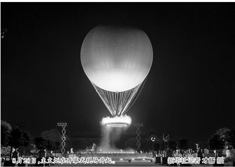
8月28日,火炬在开幕式现场升起。

舞蹈与健身动作融合的动态中成为统一的整体,寓意人类通过艺术创作与体育竞赛增进了解,呼应开幕式的主题——“矛盾:从分歧到和谐”。约有包括残疾人与健全人在内的500名表演者参与了当晚演出。