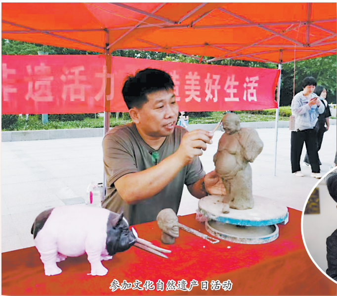
参加文化自然遗产日活动