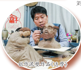
创作泥塑作品《达摩》