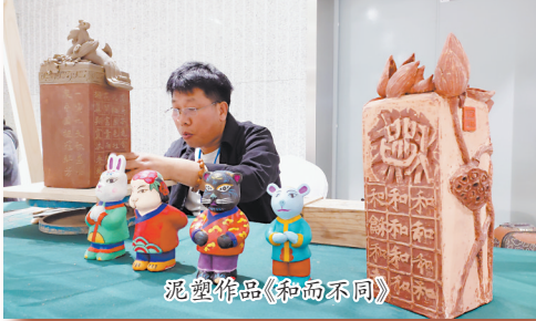
泥塑作品《和而不同》