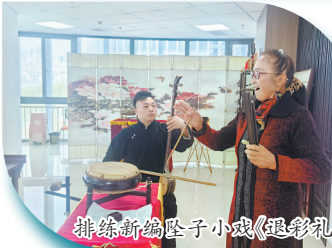
排练新编坠子小戏《退彩礼》