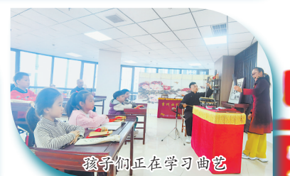
孩子们正在学习曲艺