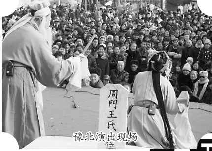
豫北演出时与观众合影