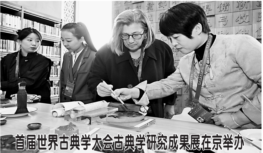
首届世界古典学大会古典学研究成果展在京举办

万余元。2015年底至2021年,被告人郑俊康违反城市轨道交通项目规划需经国务院审批后才可由省级发展改革部门审批立项的规定,在未获得国务院批复的情况下,要求有关单位以举债融资等方式建设柳州城市轨道交通项目,造成重大损失和恶劣影响。 北海市中级人民法院认为,被告人郑俊康的行为构成受贿罪、滥用职权罪,且受贿数额特别巨大,滥用职权情节特别严重,均应依法惩处。鉴于被告人郑俊康到案后如实供述自己的罪行,部分受贿款项未实际取得,认罪悔罪,全部赃款已退缴到案,依法可以从轻处罚。法庭遂作出上述判决。