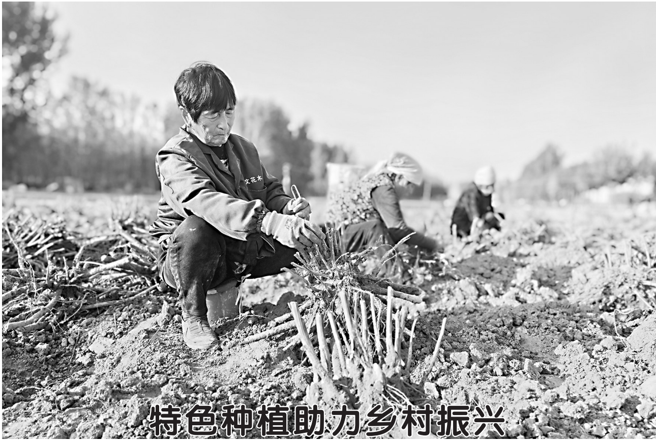
特色种植助力乡村振兴

▲11月6日，在牡丹区李村镇登文花木芍药种植基地，村民正在忙着刨坑、放苗。据悉，该基地栽植牡丹芍药达1000多亩，当地政府依托黄河冲积平原土质肥沃的优势，大力发展花卉特色种植项目，成为当地农民增收致富的新亮点。目前，牡丹区芍药鲜切花拥有国内传统品种约460个、进口品种约170个，备受消费者青睐。