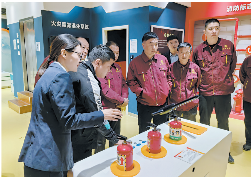
近日,鲁西新区岳程街道商会党支部组织会员企业参加消防培训

社会组织委员会成立选举党员大会。大会通过无记名投票差额选举的方式,选举产生了中共菏泽市文化和旅游局第一届社会组织委员会。