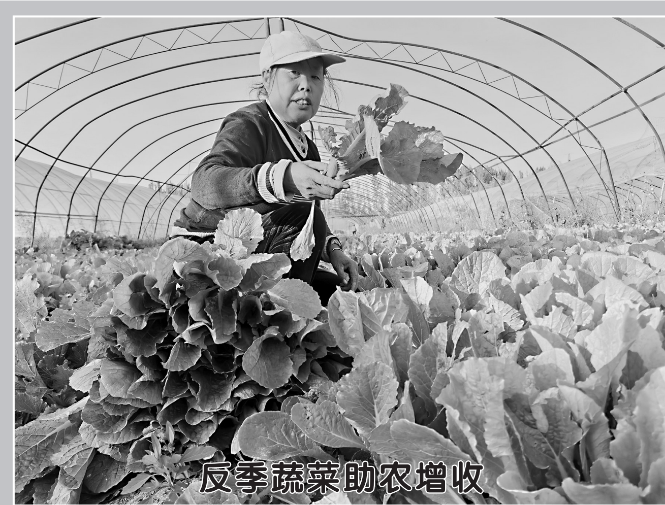
反季蔬菜助农增收

11月22日，在牡丹区李村镇黄河生态蔬菜种植基地，各类反季节蔬菜正“抢鲜”上市。近年来，牡丹区把发展设施农业作为拓宽增收渠道、增加农民收入的重要抓手，引导农户种植反季节蔬菜，促进农民增收致富。目前，全区蔬菜种植面积达40.6万亩，蔬菜总产值达36亿元。