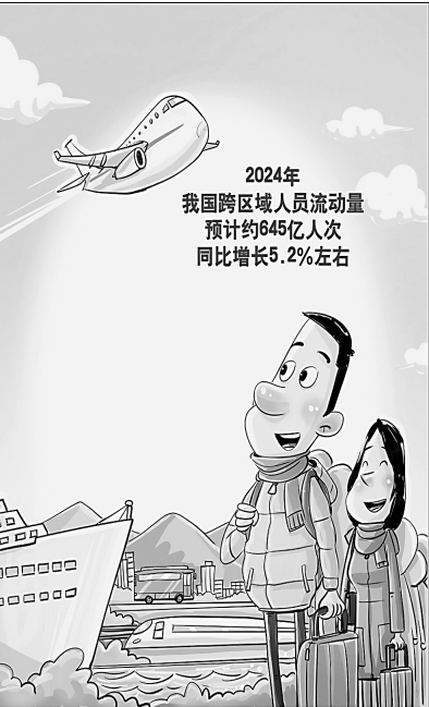
人员流量增长