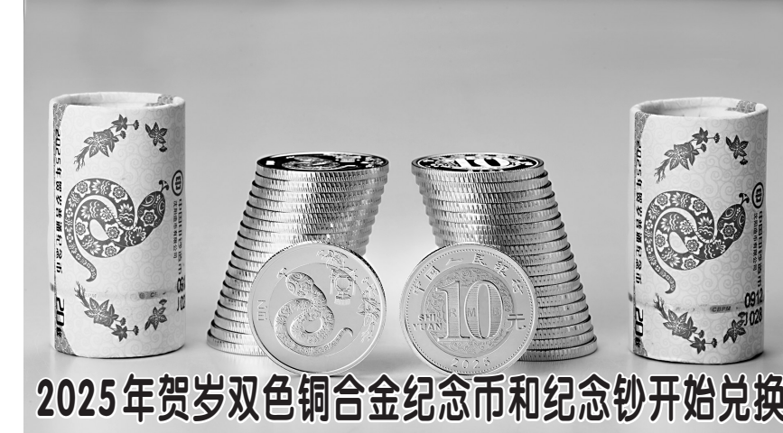
2025年贺岁双色铜合金纪念币和纪念钞开始兑换

特此公告 山东省林草生态环境有限公司 菏泽新强农业发展有限公司 2025年1月4日