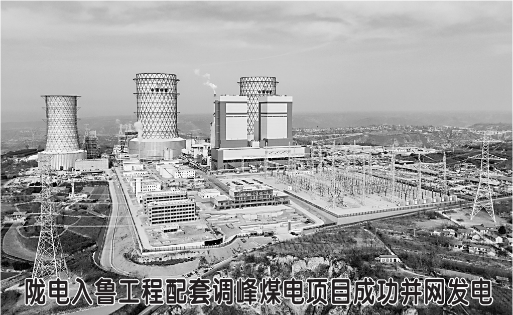
陇电入鲁工程配套调峰煤电项目成功并网发电

这是1月3日拍摄的华能正宁电厂(无人机照片)。 近日，华能正宁2×1000兆瓦调峰煤电项目1号机组并网发电。华能正宁电厂位于甘肃省庆阳市正宁县，是华能陇东多能互补综合能源基地的重要组成部分，是陇电入鲁工程的重点配套电源。待两台机组全部并网后，年发电量将达100亿千瓦时，保障陇电入鲁特高压线路安全稳定运行。