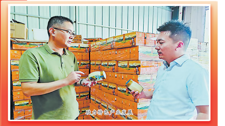
助力特色产业发展