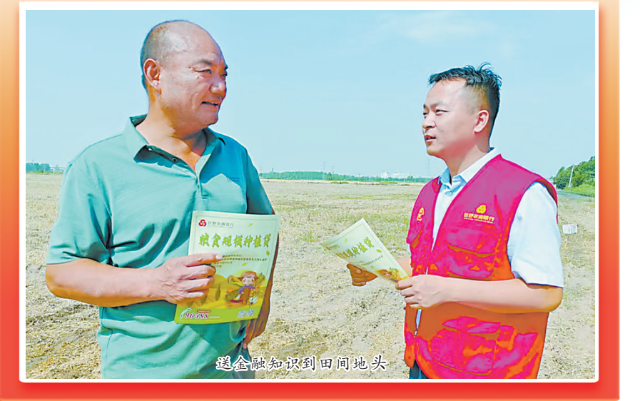
送金融知识到田间地头