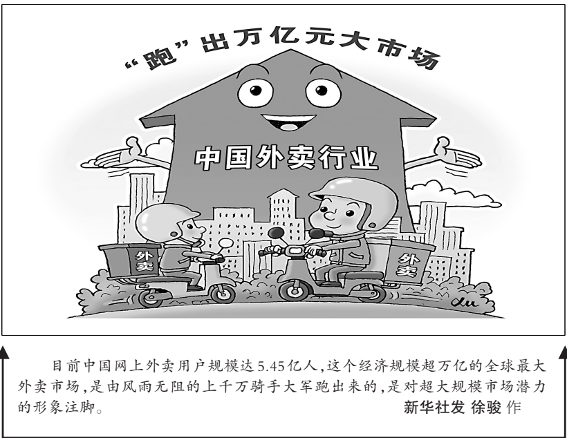
目前中国网上外卖用户规模达5.45亿人,这个经济规模超万亿的全球最大外卖市场,是由风雨无阻的上千万骑手大军跑出来的,是对超大规模市场潜力的形象注脚。

三是明确监管措施。规定证券监督管理、财政、司法行政部门应当加强信息沟通和协调配合,按照职责分工,依法对中介机构执业行为加强监管;必要时可以采取联合现场检查等措施,依法查处违法违规行为;对违反规定的中介机构及其从业人员可以采取警告、罚款、暂停从事相关业务等行政处罚,对违反规定的发行人及其控股股东、实际控制人可以采取警告、罚款等行政处罚。