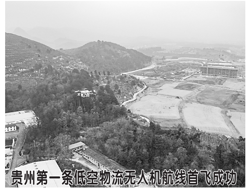
贵州第一条低空物流无人机航线首飞成功

会谈后,两国元首共同见证签署共建“一带一路”合作规划和农产品输华、社会民生、新闻广电等多项双边合作文件。