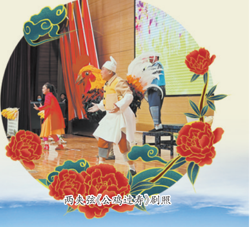
两宋戏《公鸡过寿》剧照

让黄河文化“火起来”。在坚定自信中创新性发展。黄河流域是中华文明的发源地之一，黄河文化门类繁多、形态各异与历史上这里人类聚集、人气“爆棚”是密不可分的。为何一部《大片儿》能够带火一批“洋文创”，而历史悠久的本土文化却时常苦于没有“鲜活”的载体，甚至被束之高阁？如何让一众传统文化形态恢复昔日的“人气”，再次“火起来”？同样是赋予文化创新性发展的重要课题。2024年，菏泽的仿真熊猫“火起来”了，先是在电影《动物园里有什么？》中火爆亮相，又在央视春晚C位出场，继而“客串”多部主题电影并在各大电商平台“炙手可热”，一“猫”难求。来自菏泽的“熊猫工厂”，巧妙地将传统裘皮技艺与国宝熊猫形象相结合，遴选优质皮毛原材料，无论毛发质感、手感等，都非常接近真实熊猫，在玩偶市场备受追捧。目前，这里仿真熊猫年销量超过30000只，已成为远近闻名的出口创汇企业。2024年，从“新春战袍”“马面裙”等一系列关联菏泽曹县汉服的话题爆火春节档后，“400名大学生回曹县小镇卖马面