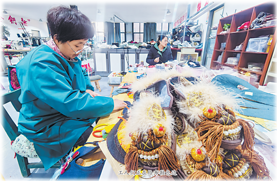
工人们正在给布鞋包边