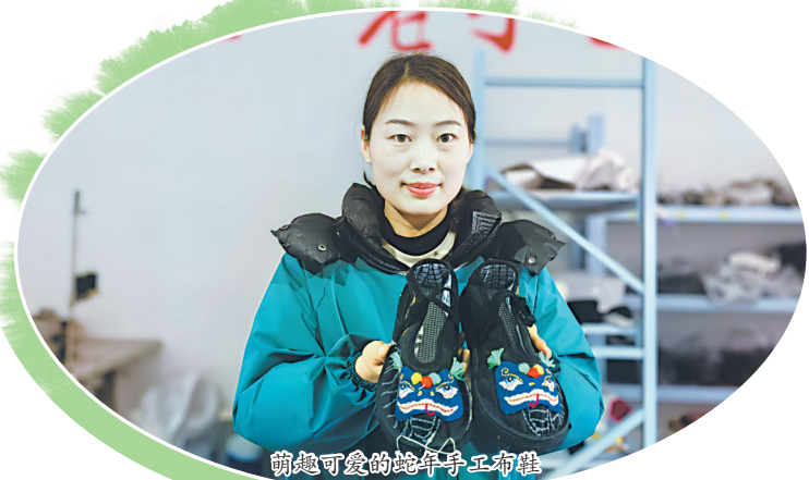
萌趣可爱的蛇年手工布鞋