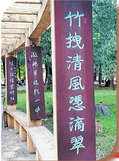
▲环城堤公园楹联文化长廊