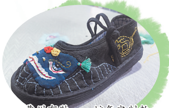
曹州布鞋——蛇年定制款