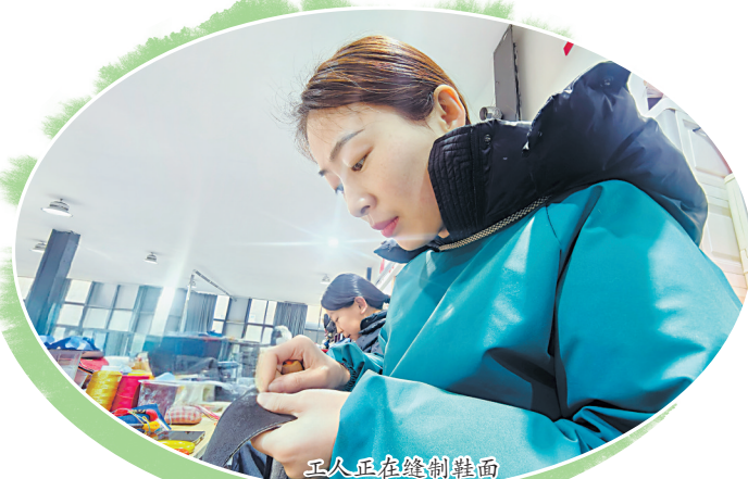
工人正在缝制鞋面