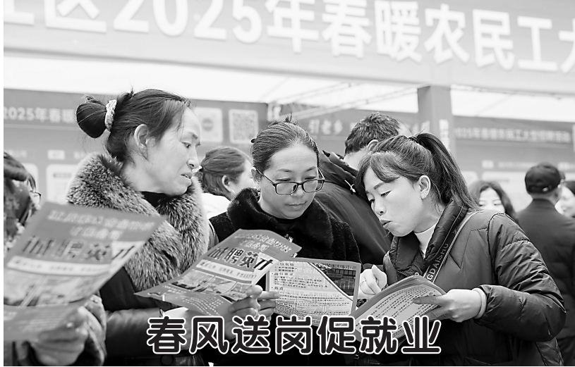
春风送岗促就业 ▲2月4日,人们在重庆市黔江区红军广场招聘活动上了解招聘信息。 新春伊始,全国各地组织多场招聘活动,为求职群体提供工作岗位,助力企业复工复产。

新和县100公里、距拜城县170公里,距铁门关市176公里。 记者了解到,库车市、库尔勒市、阿拉尔市等地有震感。根据中国地震台网速报目录,在震中附近25公里范围内,曾发生2级以上地震181次,最大震级为5.6级。其中3-4级地震170次,4-5级地震7次,5级以上地震4次。