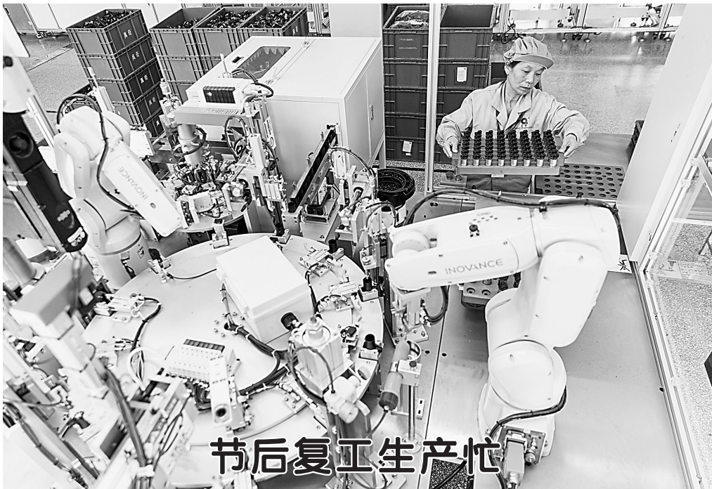
节后复工生产忙 2月5日,浙江省温岭市石桥头镇浙江真奇汽车零部件有限公司工人在车间里生产洗涤泵订单产品。 当日是春节假期后首个工作日,各地企业铆足干劲忙生产,力争首季“开门红”。 新华社发

新华社北京2月5日电 为进一步健全成品油流通管理体系,推动成品油流通高质量发展,国务院办公厅日前印发《关于推动成品油流通高质量发展的意见》,提出5方面21条具体举措。 一是完善成品油流通管理制度。对成品油批发仓储经营实施备案管理,制定并严格执行全国统一的成品油零售经营资格准入标准。督促企业严格落实成品油台账管理规定,推进成品油经营企业信用分级分类管理。二是健全成品油流通跨部门监管机制。要求地方各级人民政府建立成品油流通跨部门联合监管机制,落实属地监管职责。严格落实综合行政执法改革要求,明确日常监管和执法职责。推进成品油流通大数据管理体系建设,加强数据共享应用,加快构建涵盖批发、仓储、运输、零售等环节的全链条、可追溯动态监管体系。三是加强成品油流通重点领域监管。强化安全生产监管,加强环保达标管理,加强质量计量监管。规范互联网销售成品油行为,严厉打击成品油流通领域违法违规行为。四是促进成品油流通现代化发展。优化成品油零售网点布局,鼓励大型骨干企业将零售体系向农村及偏远地区进一步延伸,支持农村加油站升级改造。支持加油站因站制宜设立便利店,推出便民洗车、汽配维修及保养等服务,提升网点服务水平。促进成品油零售企业连锁经营,加快绿色低碳转型发展。五是保障措施。要求各地区和有关部门加强组织领导,完善激励约束机制,营造良好发展环境,共同促进成品油流通规范有序高质量发展。