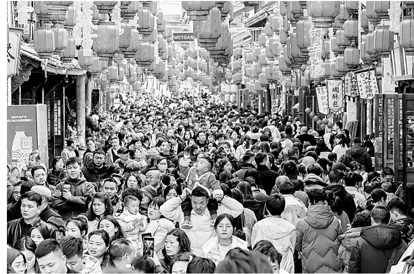
▲1月29日,游客在贵州省安顺市西秀区安顺古城历史文化街区游玩。