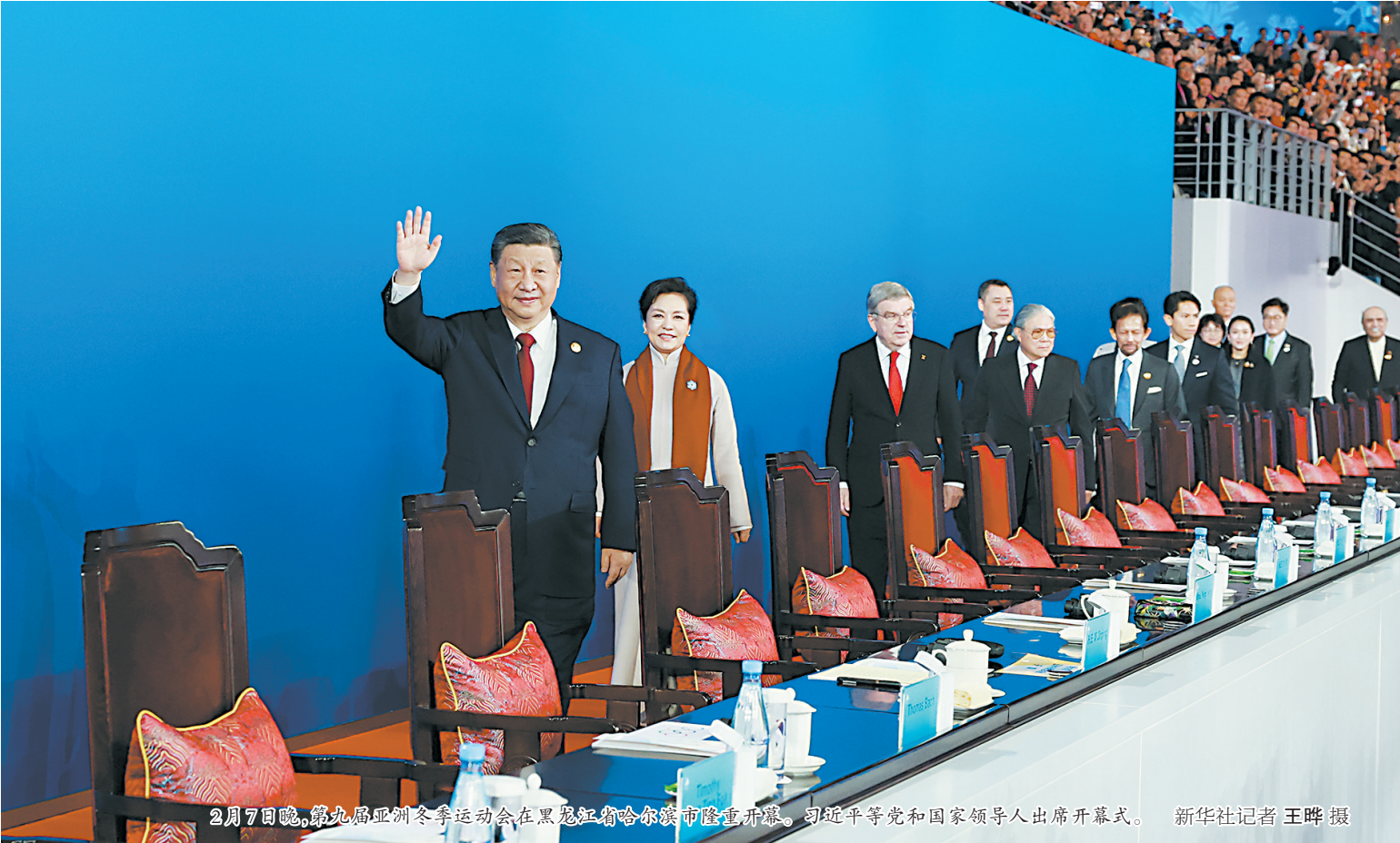
2月7日晚,第九届亚洲冬季运动会在黑龙江省哈尔滨市隆重开幕。习近平等党和国家领导人出席开幕式。

哈尔滨亚冬会组委会主席、中国奥委会主席高志丹在致辞中表示,在习近平主席亲切关怀和坚强