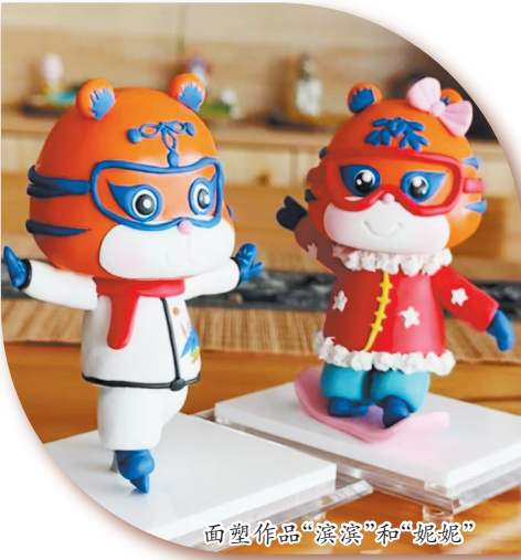
面塑作品“滨滨”和“妮妮”