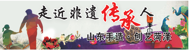
走近非遗传承人 山东手造·创艺菏泽