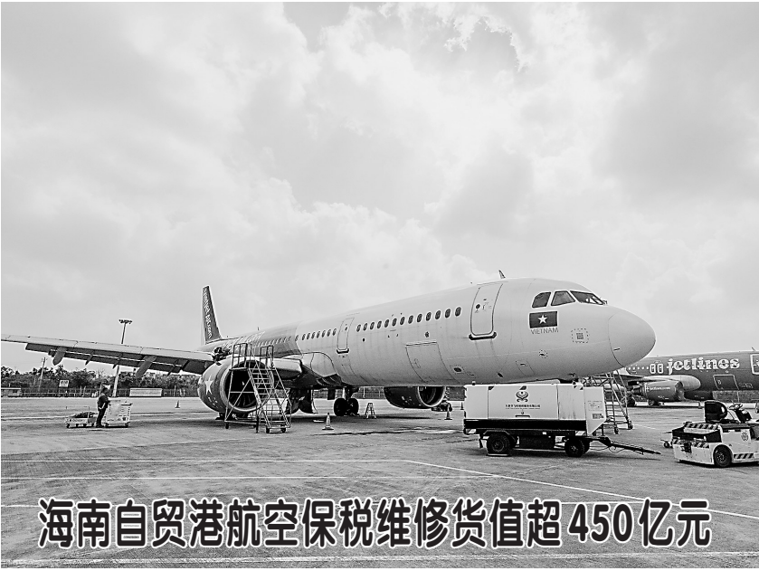
海南自贸港航空保税维修货值超450亿元