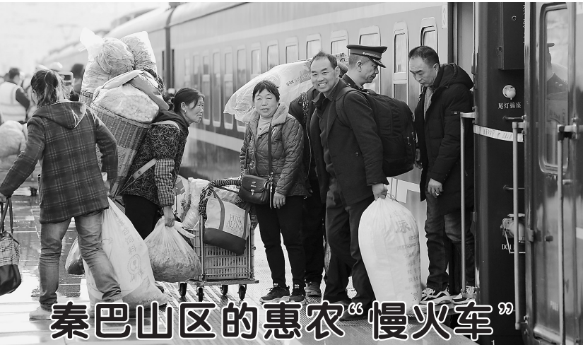
秦巴山区的惠农“慢火车”

新华社北京2月18日电（于尚波 吴晶）“不跟着学习，会不会落伍？”针对喧嚣一时的各类AI技能学习付费课程，专家指出，大众不要被AI“技术流”裹挟，AI作为工具无需“知识付费”。 “就像使用智能手机一样，AI越来越成为智能时代的一项便利化工具。”一位智谱公司的算法工程师在接受记者采访时表示，应将AI产品简单看作一项让生活更方便、工作更高效的工具。我们只需登录网页或软件，就可以根据页面提示进行操作。而学习使用“手机”，并不需要购买付费课程。 目前，互联网上的AI知识都是开源的，所有人都可以获取。但是，对于普通人来说，从哪里寻找资料以及能否跨越语言瓶颈是现实门槛。 “AI搜索虽然能在短时间内找到用户需要的答案，但提供的答案有时并不准确，用户仍需要在AI搜索给出的结果中自行筛选有用的信息。”科技部国家科技专家库专家周迪说，也恰恰是这一点，揭示了AI时代和此前所有时代共通的学习的本质，那就是保持理性、明辨真伪。 在DeepSeek爆发后的短短一个月内，某知名知识付费平台上关于AI技能的