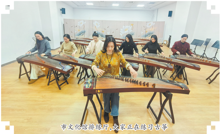
市文化馆排练厅,大家正在练习古筝