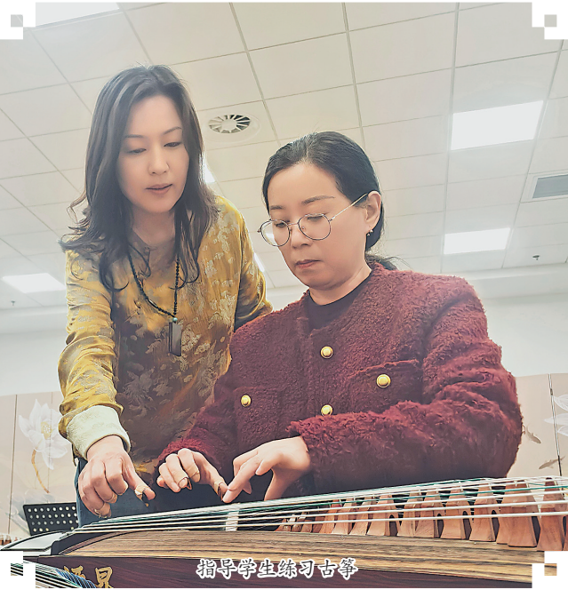
指导学生练习古筝