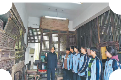
在展室为学生讲解传统木雕艺术知识